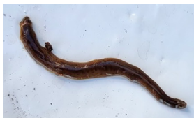
Lövplattmask, Obama nungara .