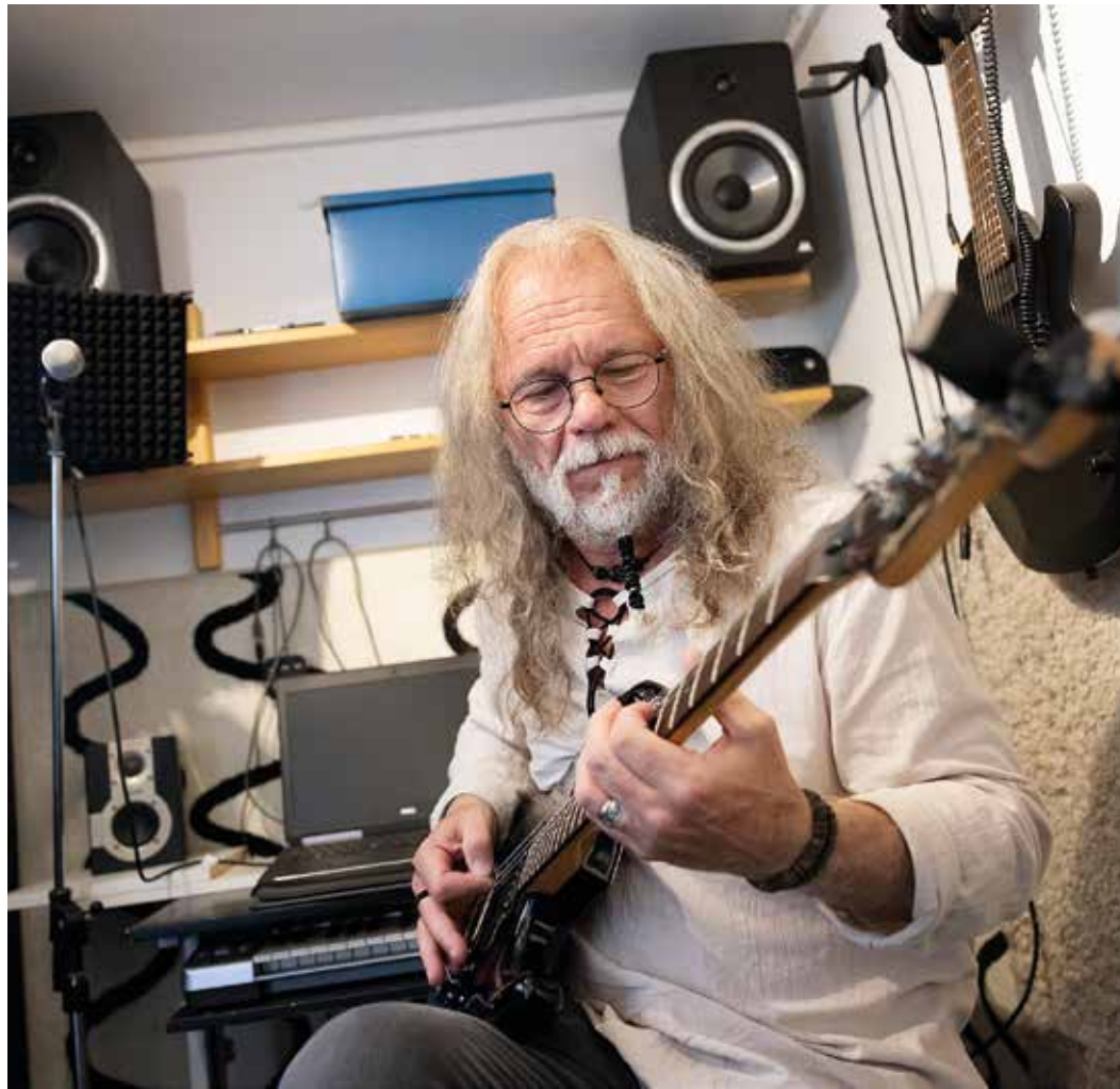
Johan skapar sina låtar från grunden och lägger de flesta stämmorna själv

Johans vilja att skriva egna låtar och arbeta