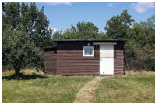
Studion ligger i ett hörn av trädgården