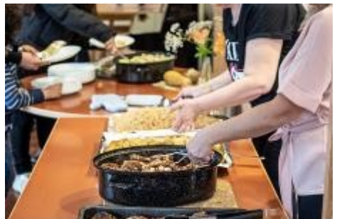
Ikon

Vuxen 70 kr, ungdom 13-18 år 40 kr, barn 0-12 gratis.