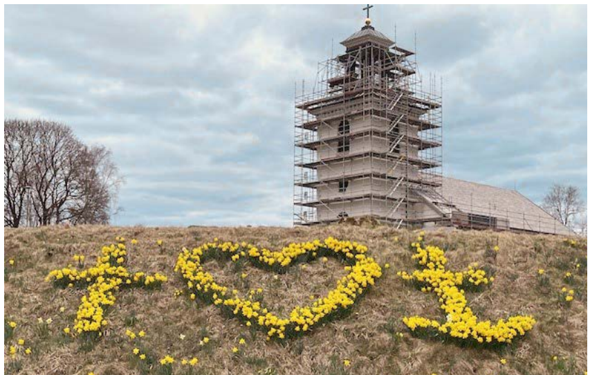
Rångedala kyrka har renoverats! Nylagt skiffertak, renoverad och ommålad port, målning av fönster och trädetaljer, ny puts och färg på fasaden.