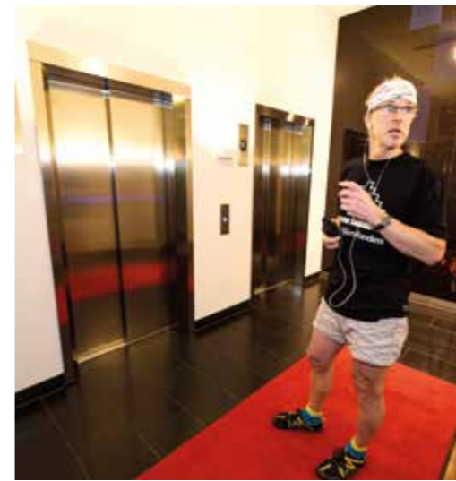
I väntan på hissen.