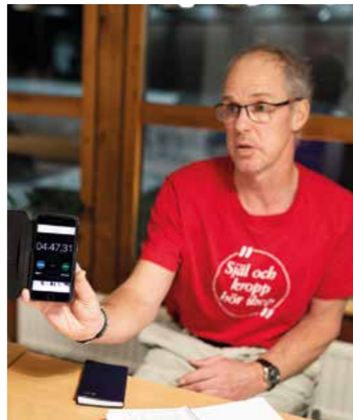
Tiden mäts i mobilen. 4:47:31 är snabbast hittills.