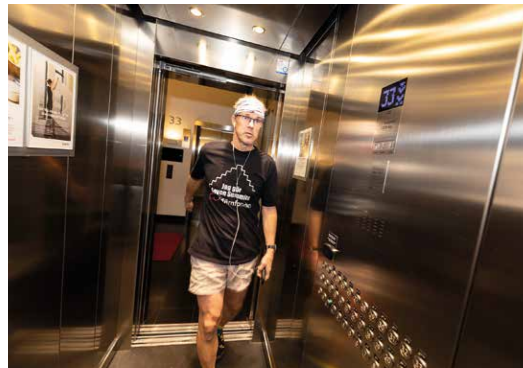
Tar hissen ned för att spara knäna.