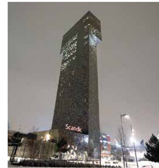
Victoria Tower Hotel by night.