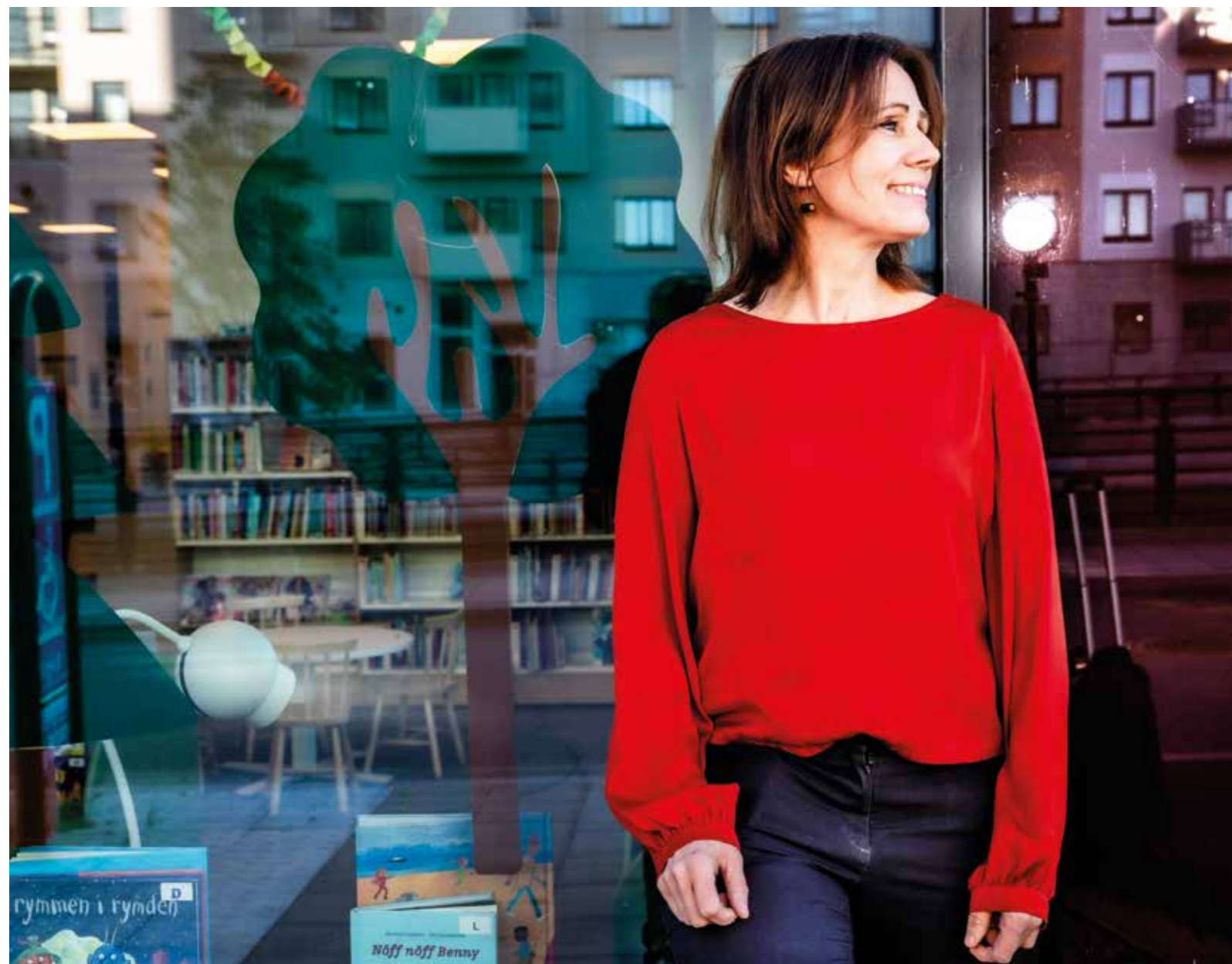
Utanför arbetsplatsen i Bas Barkarby.