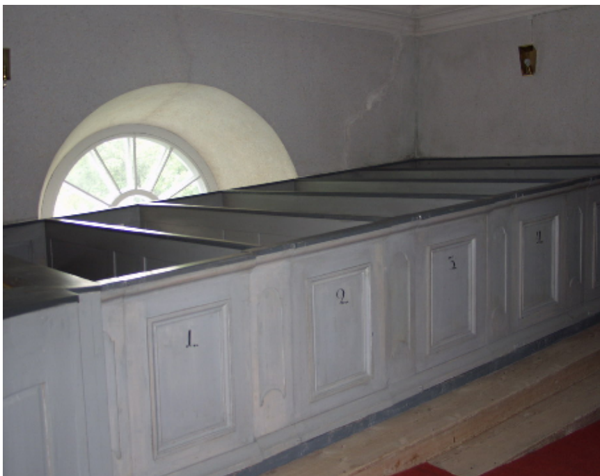
Orgelläktarens ursprungliga trägolv och sex bänkrader