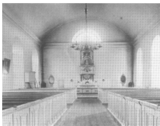
Kyrkorummet före 1903 Digital kopia av äldre foto

Kyrkan uppfördes helt i natursten, därtill ovanligt kraftiga block. Utformningen var i tidens anda; slätputsade vita fasader och stora, symmetriskt placerade dörrar och fönster. Långhustaket täcktes med svartmålad järnplåt, vilket var relativt tidigt och förklaras av socknens betydande järntillverkning. Kyrkorummets valv och väggar blev enhetligt vitkalkade. Den ursprungliga bänkinredningen var sluten, målad pärlgrå. Predikstol med rik förgyllning var placerad ovan altaret som lystes upp av ett halvmåneförmigt fönster, vars rutor bemålats med änglahuvuden.