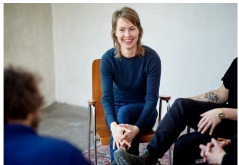
I gruppen bearbetar alla en specifik utmaning eller längtan i sitt eget liv.