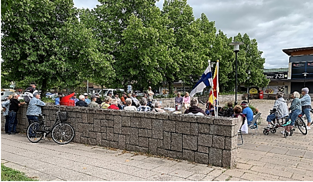
Finskspråkig diakon och musiker möter människor på Hammartorget i Hallstahammar.

i bygdens aktiviteter och sammanhang, alltifrån hembygdsdagar till enskilda möten på torget. Det är viktigt att finnas på samhällets olika mötesplatser, och i enskilda människors liv, också utanför församlingshemmens/kyrkornas väggar. I ord och handling ska berättelsen om Jesus vara levande i mötet med andra.