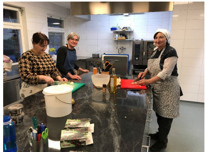
Inför språkcafé för ukrainare i Hallstahammar.

ideella krafter med aktuella språkkunskaper. Vid dessa kaféer möter ofta barnfamiljer upp.