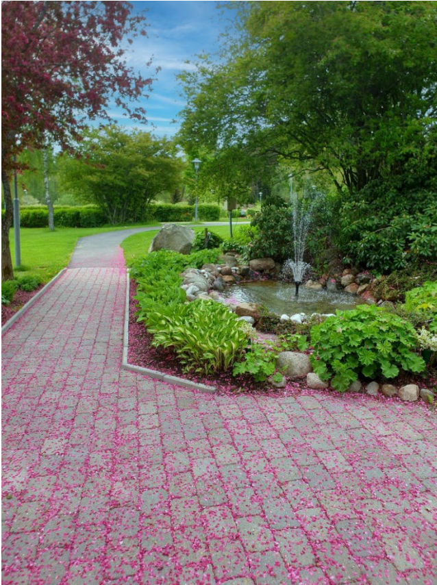
Vid minneslunden på Svedvi kyrkogård.

S:t Lars kyrka i Hallstahammar är den nuvarande huvudkyrkan, och är byggd (invigd) 1955. Här firas söndaglig huvudgudstjänst. I kyrkan har en särskild plats för barn ställts i ordning, där barnen kan ”leka kyrka”. Kyrkan står öppen under dagtid, och närheten till församlingshemmet är en fördel. Utanför kyrkan finns en relativt nyanlagd minnesplats.