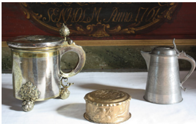
Vinkanna och oblatask från 1600-talet samt tennkanna från 1856