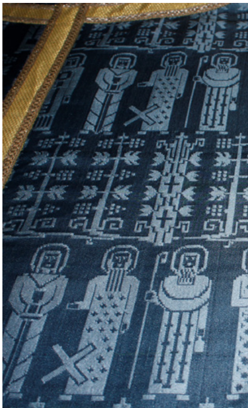
Blå mässhake från 1958

Den höga klockstapelns uppfördes av byggmästare Nils Uhrberg