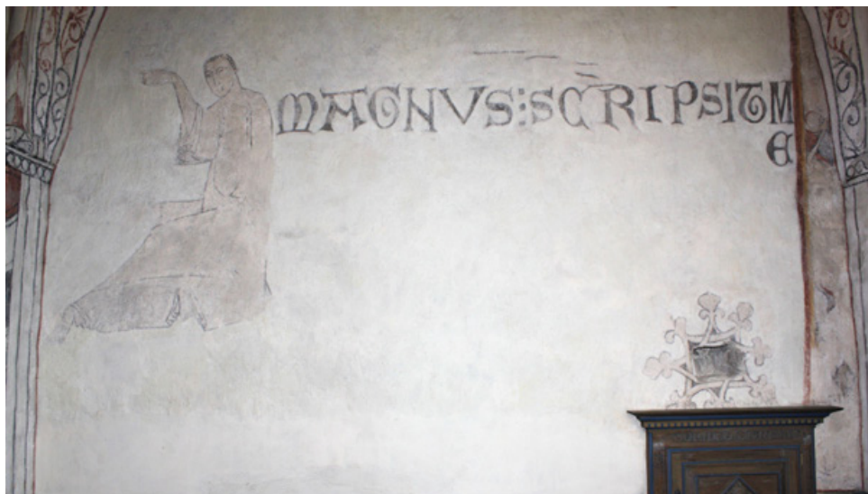
1200-talsmålari, östra koret