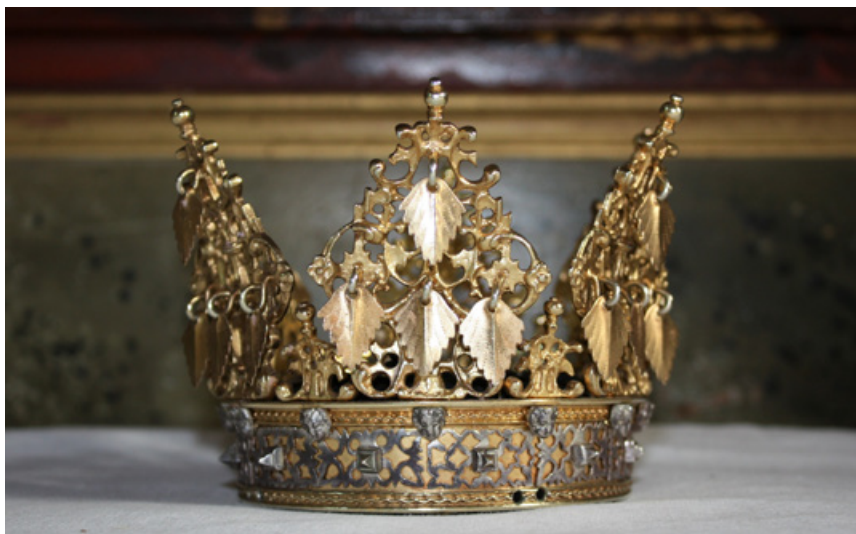
1959 Brudkrona från 1699