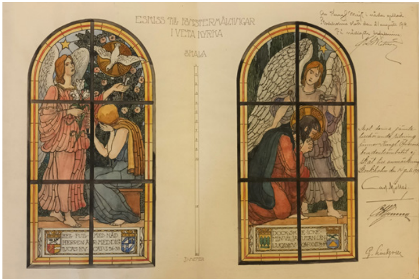
Skisser till norra korets glasmålningar

en dopfunt från 1988 med fot skulpterad i trä och dopskål i mässing. Foten är utförd av bildkonstnären Eva Spångberg och guldsmed Folke Johansson i Mjölby har gjort dopskålen i form av en snäcka som harmonierar med predikstolens musselornament.