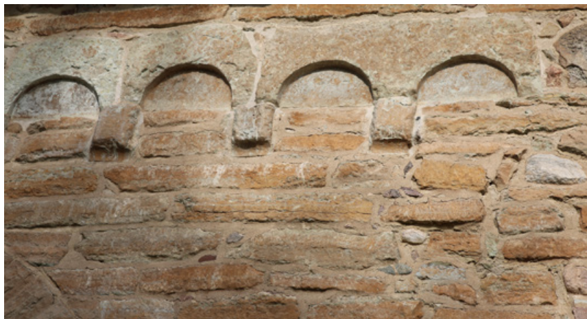
Den romanska rundbågefrisen

Runt den medeltida kyrkan fanns en profilerad kalkstenssockel av ovanlig form. Rester av den ursprungliga sockeln syns i dag inne i den tillbyggda sakristian och i skrudkammaren. Utsidans sockel är en rekonstruktion från 1913–14. Eventuellt kommer en del profilerade kalkstenar som är inmurade på olika ställen i korsarmarnas murverk från den medeltida sockeln. Det äldsta, romanska, koret kröns av en rundbågefris som vilar på fyrkantiga konsoler med konkav avslutning, så kallade hålkäl. Stensockeln, rundbågefrisen och en ovanlig målning från 1200-talet i det äldsta koret (se sidan 10) tyder på att Veta kyrka uppfördes av någon betydande person eller personer. Rundbågefriser finns på några andra kyrkor i Östergötland bland annat Hogstad.