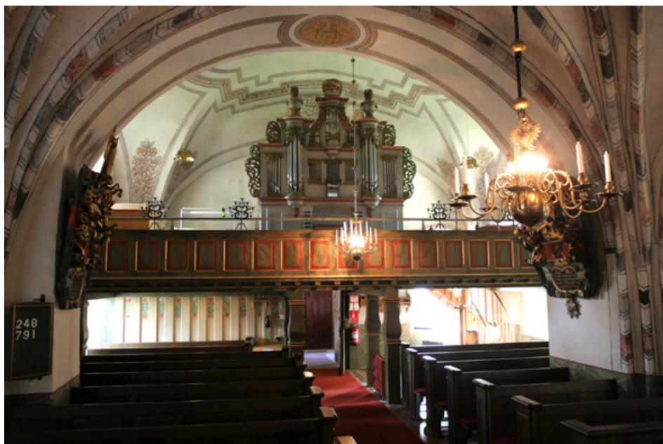
Orgelläktare, södra korsarmen