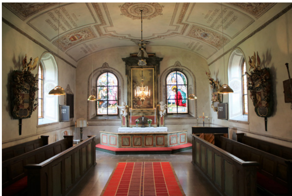
Norra koret, korsarmen

var en dörröppning mellan långhusets och korets vindar. Öppningen är dock omsorgsfullt utförd och putsad, vilket tyder på att den kan ha haft en viktigare funktion än att bara förbinda två vindar.