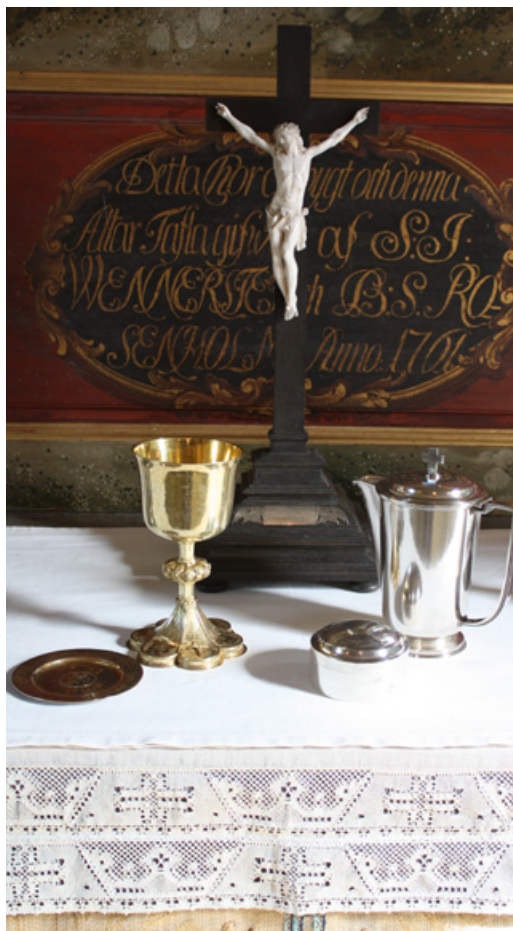
Kalk med medeltida fot, oblatask från 1786, vinkanna från

Brudkronan i förgyllt silver köptes 1699 och är tillverkad av Henning Petri i Nyköping. Kronan är bevarad oförändrad och i stort sett lik den i Viby, men är något tyngre. År 1702 beskrivs att den har "12 spiror 6 stora och 6 små och 30 löf".