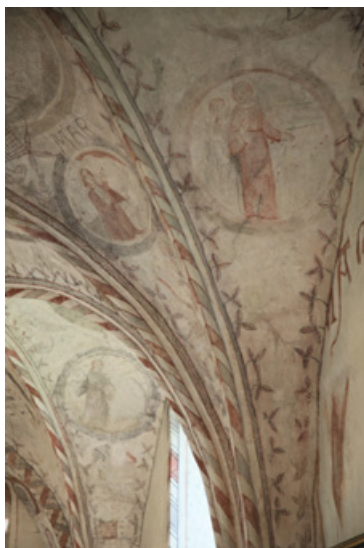
1400-talsmåleri i valven

År 1588 tillkom några stora figur- målningar samt stora blommor. Långhusets norra vägg visar ett motiv från S:t Göranslegenden. S:t Görän dräper draken och över huvudscenen avbildas den bedjande prinsessan som skulle ha offerats till draken, kungen i sin borg och en kyrka. På korets norra vägg avbildas Simson och lejonet och nedanför dem är det troligen en nattvardsscen. Här dateras målningarna till 1588 och det finns även två målade bokstäver, kanske konstnärens initialer.