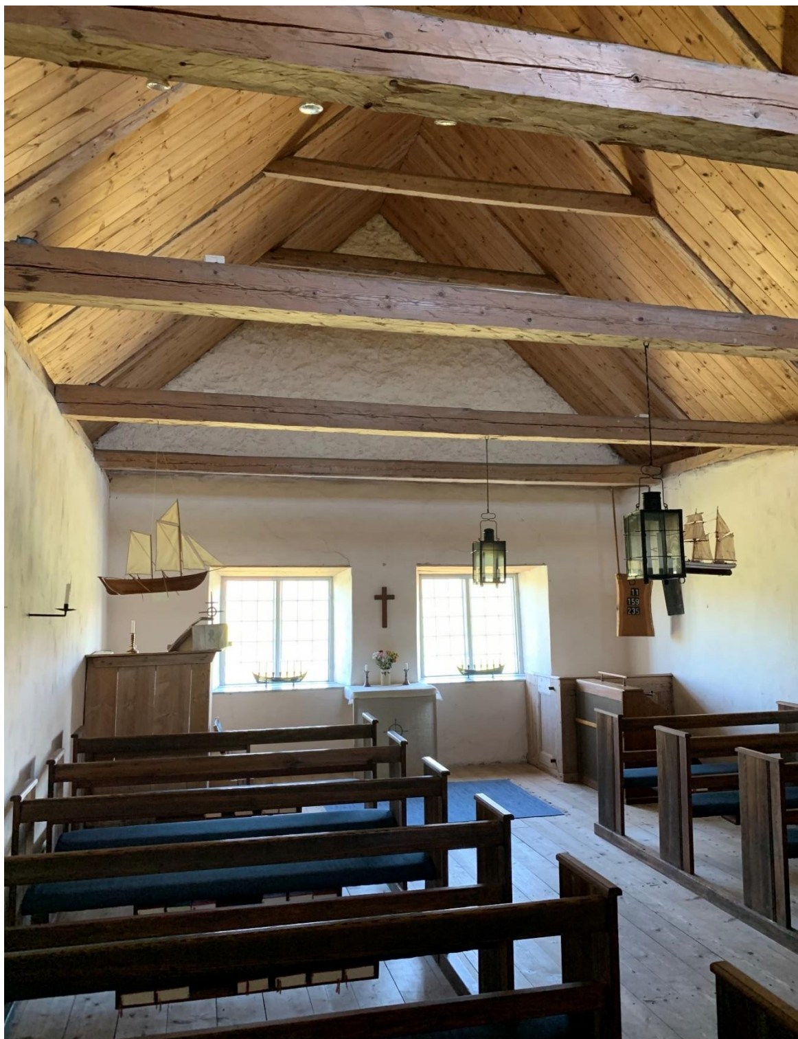
Interiör mot öster.