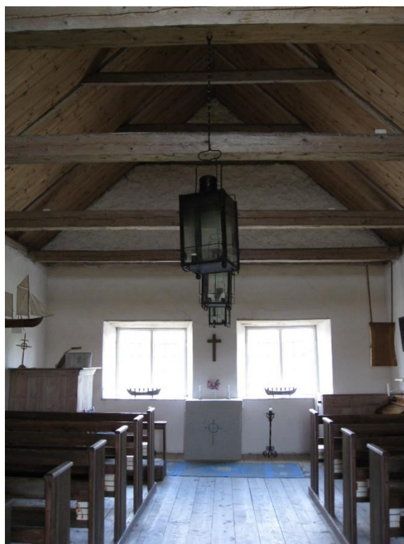
Till höger: Interiör mot öster efter 1970. Foto Rebecka Svensson 2008. Visby stift.