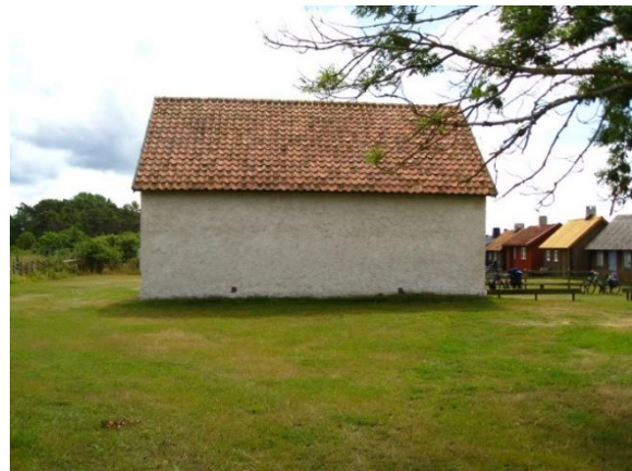
Till vänster: Kapellet från sydöst. Till höger: Kapellet från norr. Visby stift.