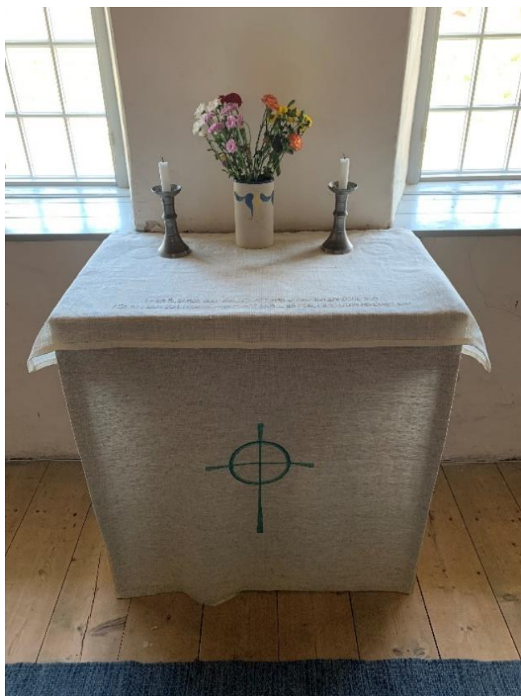
Altaret. Foto JL 2020.