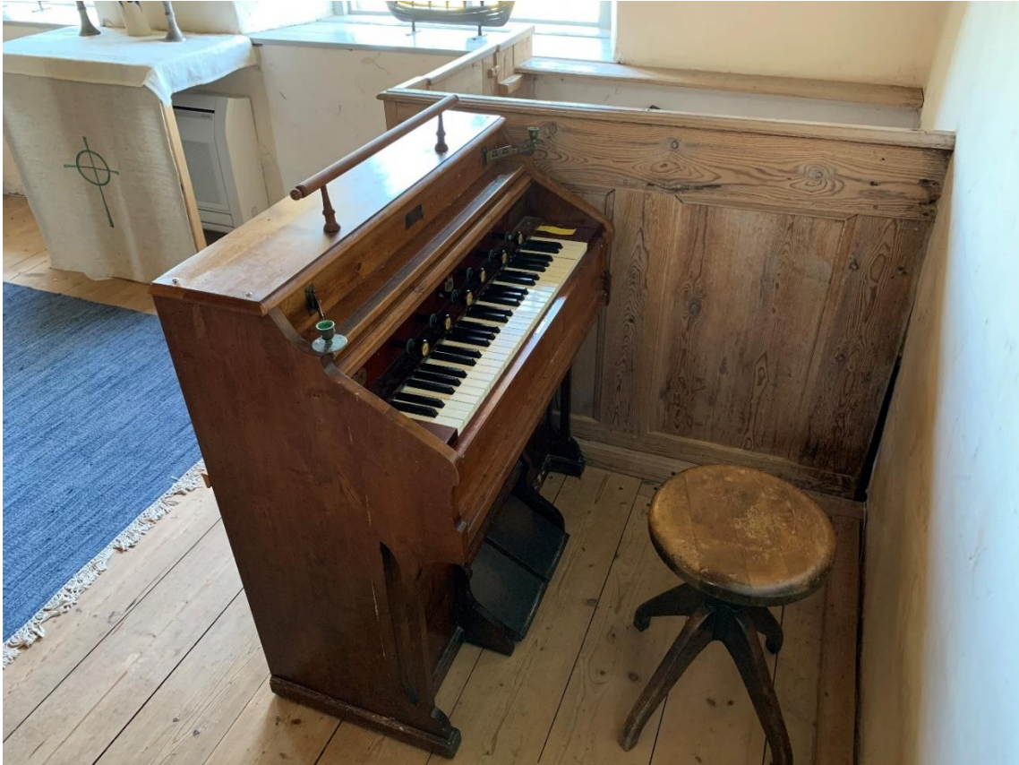
Orgelharmonium. I bakgrunden korbänken och altaret.