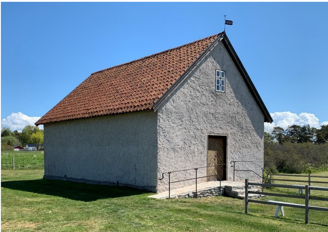
Kapellet från nordväst.