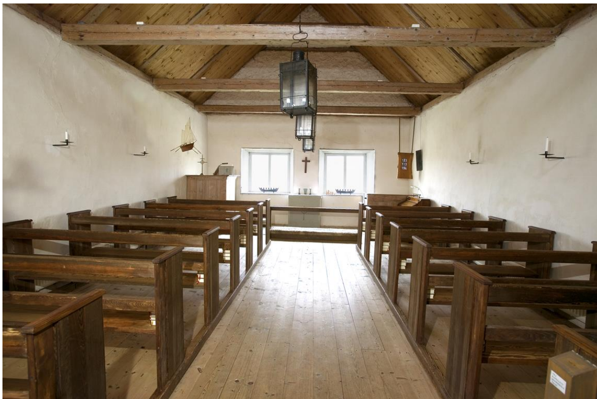
Interiör mot öster. Foto Bo-Göran Kristoffersson 2004–09. Visby stift.