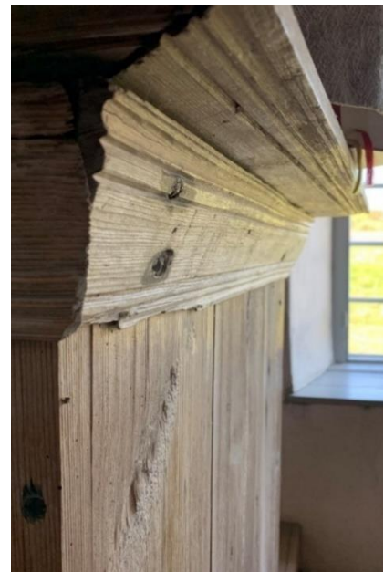
Gallerverk på predikstolens insidor åt söder och norr. Till höger predikstolens profilerade kransgesims.