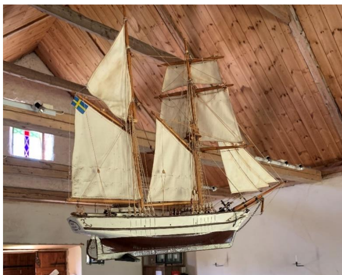
Kyrkskepp. Foto JL 2020.