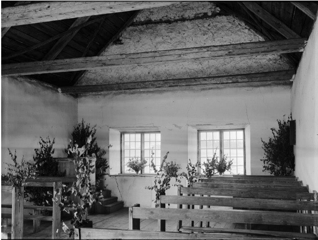
Interiör mot öster. Foto Alfred Edle 1938. RAÄ, Kulturmiljöbild.