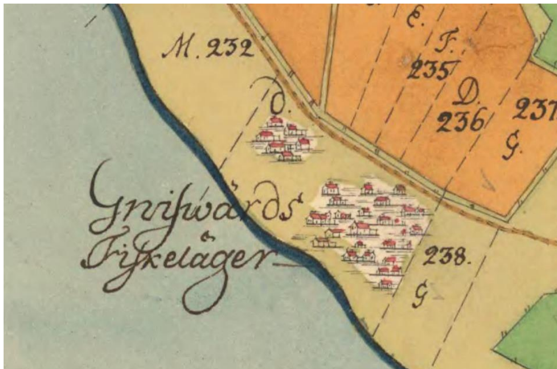
Gnisvärd fiskeläge. Skattläggningskarta 1752. Det lilla kapellet i trä som md stor sannolikhet fanns vid denna tid är inte markerat på kartan.