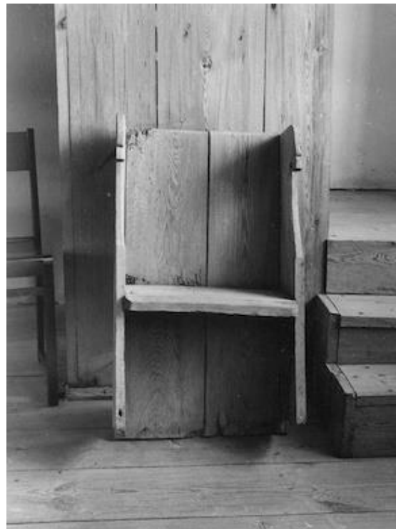
Till vänster: Altaret utan klädsel i tidigare utförande. Nu ersatt av en stolpburen skiva. Foto Bo-Göran Kristoffersson 2004–09. Visby stift. Till höger: Bekännelsepall. Foto Marianne Olsson, 1950-talet? Gotlands Museums arkiv.