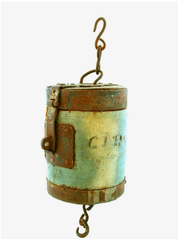
Till vänster: Kollektbössa. Foto Bo-Göran Kristoffersson 2004-09. Visby stift Till höger: Trumma för sammankallning till gudstjänst. Foto Bo-Göran Kristoffersson 2004-09. Visby stift