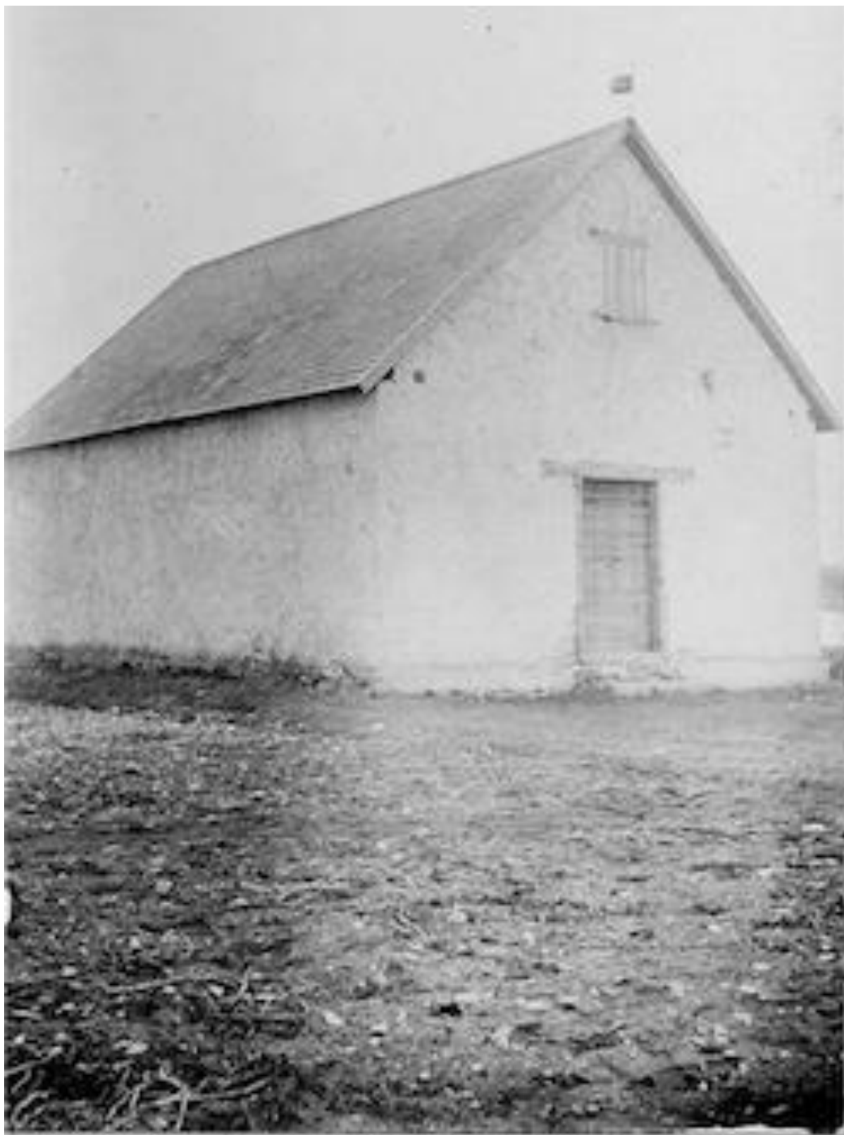
Kapellet från sydväst, troligen vid 1900-talets början. Staket saknas kring förgården. Trappan mycket enkel. Möjligen ett enklare fönster i gaveln än i dag.