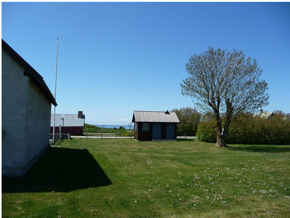
Området norr om kapellet. Foto ES 2020.