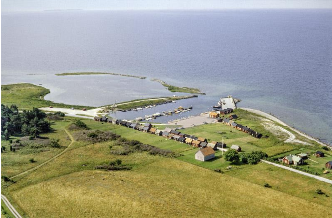
Gnisvård från nordöst med kapellet i förgrunden. Foto Jan Norrman 1996. RAÄ, Kulturmiljöbild.