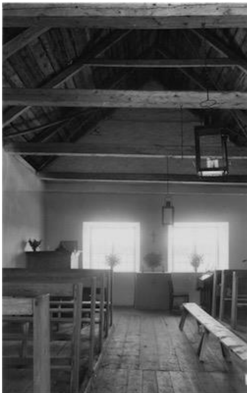
Till vänster: Interiör mot öster före 1970. Foto Inga-Lill Granlund, 1950-talet? Gotlands Museums arkiv.