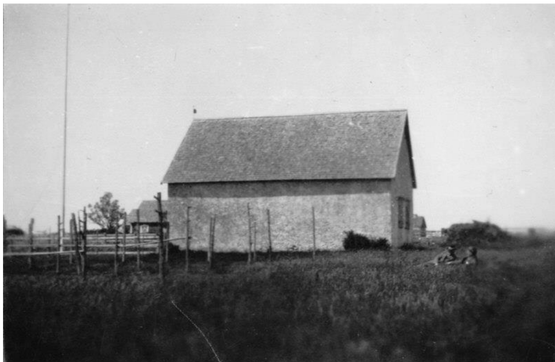
Exteriör från söder. Foto Sven Brandel 1921. RAÄ, Kulturmiljöbild.