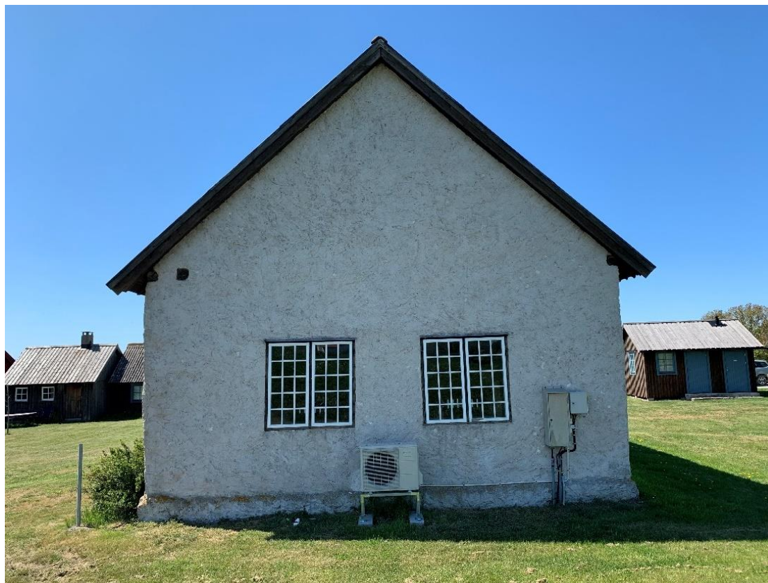
Östfasaden. Foto JL 2020.