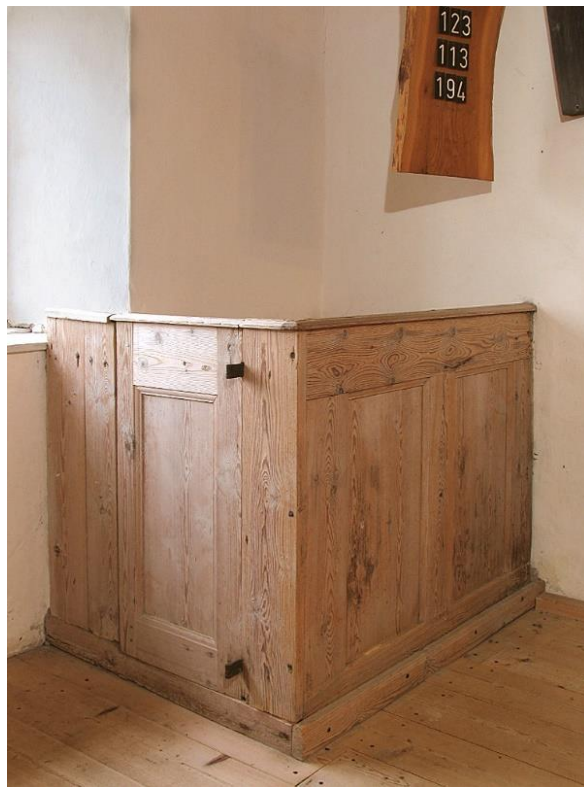
Kapellets sydöstra hörn med korbänk, nummertavla och orgelharmonium. Foto Rebecka Svensson 2008. Visby stift. Till höger: Korbänken. Foto Bo-Göran Kristoffersson 2004-09. Visby stift.