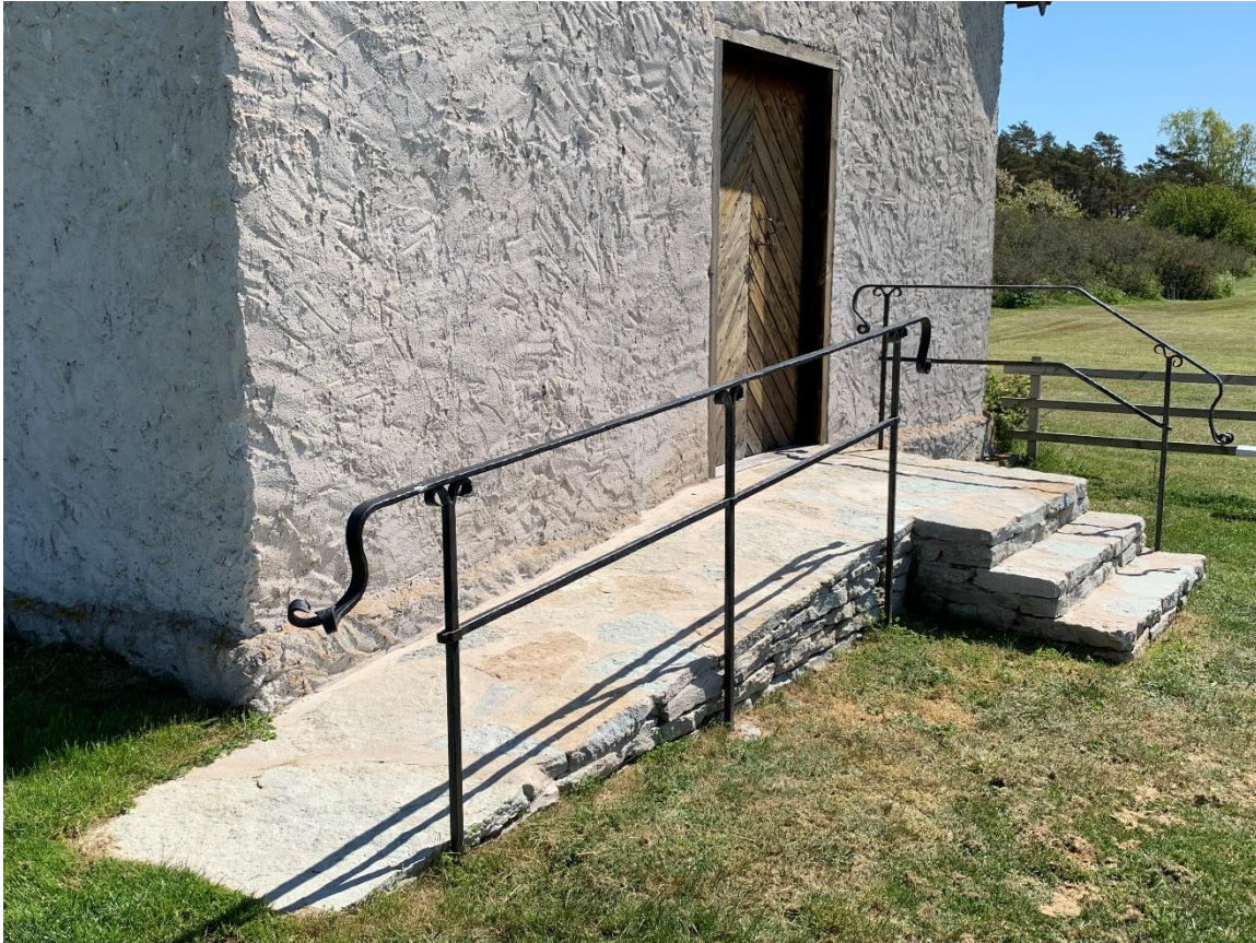
Ramp, byggd 2018. Foto JL 2020.