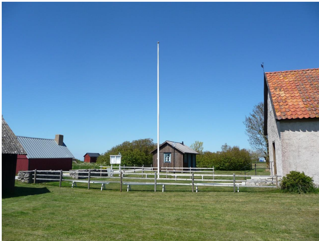
Förgården fotograferad från söder. Foto ES 2020.