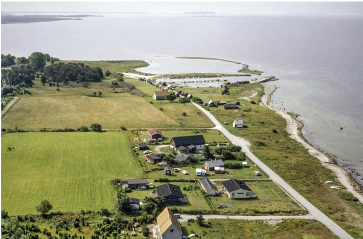
Gnisvård från norr. Foto Jan Norrman 1996. RAÄ, Kulturmiljöbild.