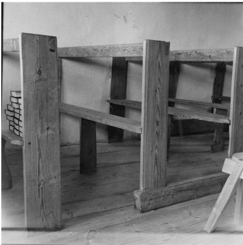
Bänkinredning, troligen delvis ursprunglig, avlägsnad 1970. Foto Marianne Olsson, 1950-talet? Gotlands Museum arkiv.