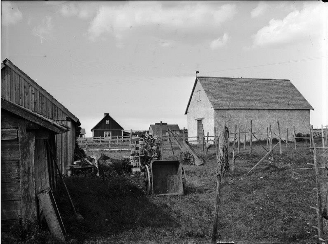
Gnisvård kapell fotograferat från sydväst.