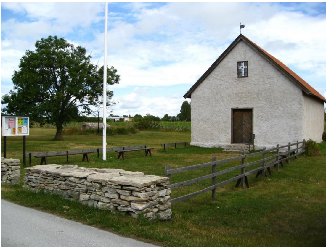
Kapellet och förgården från sydväst, innan dörrtrappan byggdes ut och västfönstret målades om. Foto Rebecka Svensson 2008. Visby stift.