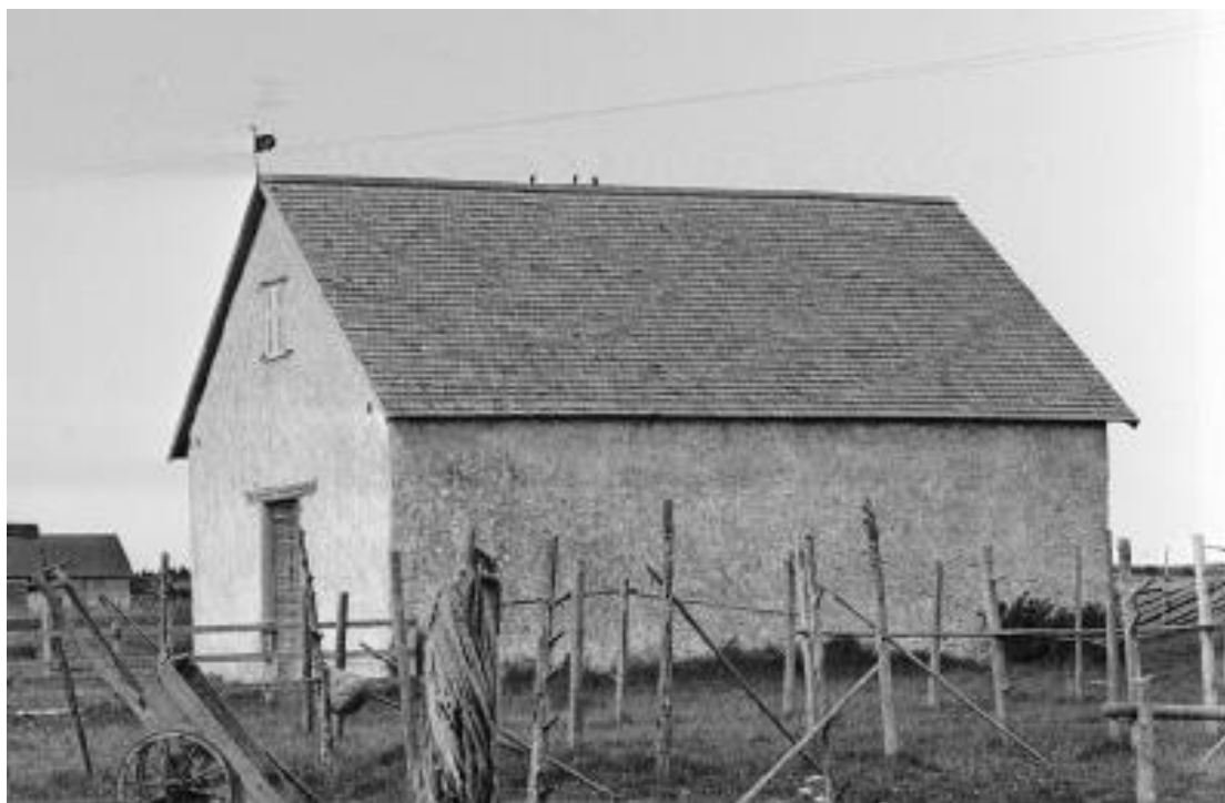
Gnisvård kapell från sydväst. Foto Alfred Edle 1938 (detalj). RAÄ, Kulturmiljöbild.