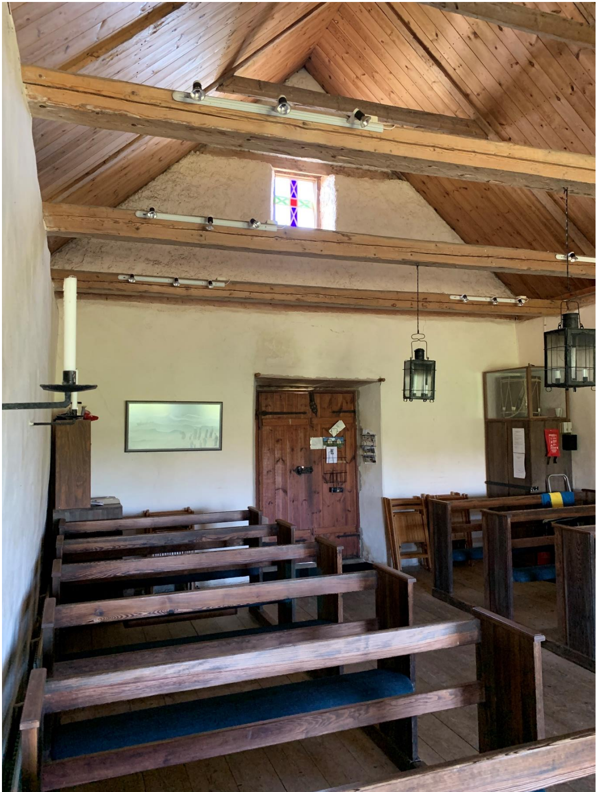
Interiör mot väster.