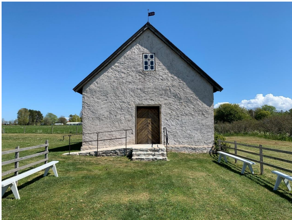
Kapellet västfasad med förplats för samlingar utomhus eller när kapellet är för litet. Foto JL 2020.