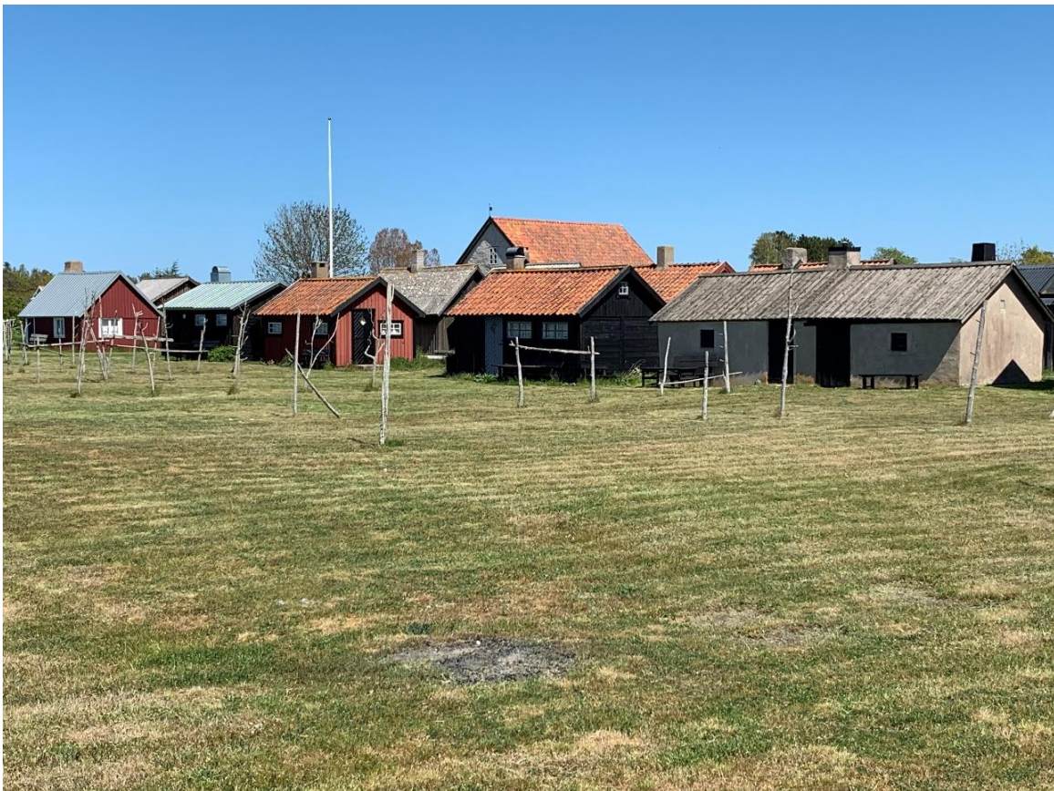
Gnisvård fiskeläge från sydväst och hamnen. Kapellets tak reser sig över fiskebodarna.