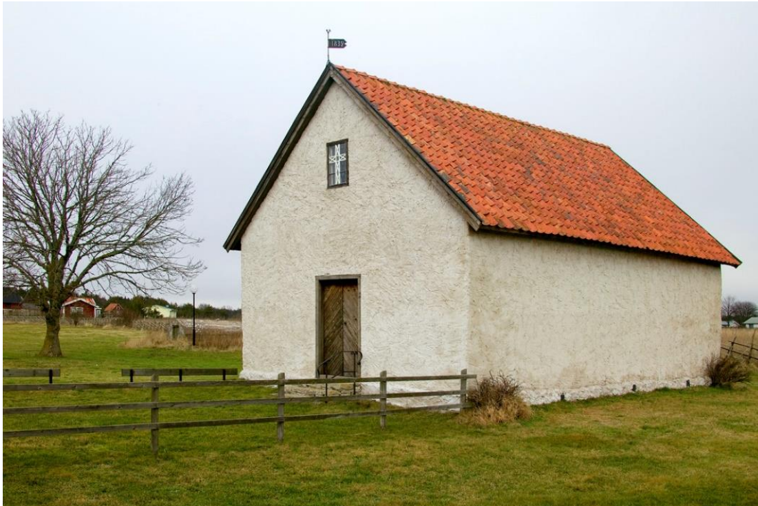
Kapellet från sydväst under 2000-talet. Foto Bo-Göran Kristoffersson 2004–09. Visby stift.