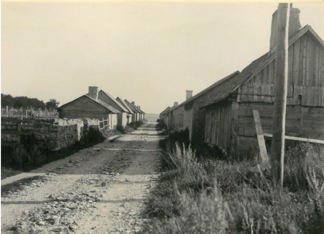
Gatan mellan strandbodarna 1932. Gunnar Johanssons bildarkiv. Gotlands Museum.