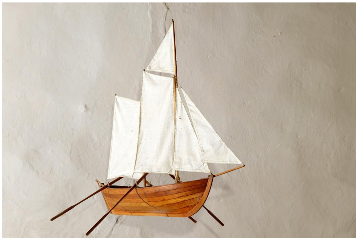
Kyrkskepp av Henry Ahlquist, Sanda, 1970. Foto Bo-Göran Kristoffersson 2004-09. Visby stift