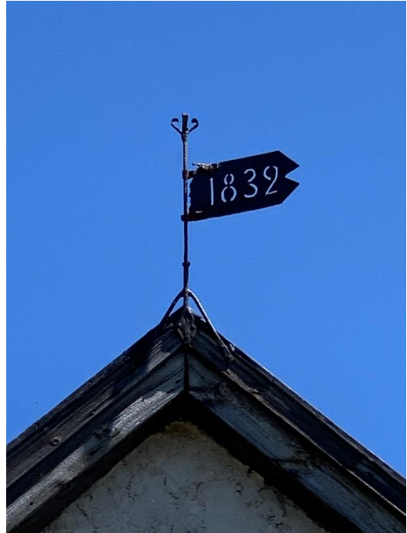
Detalj av trappans smidesräcke från 2001. Till höger smidd vindflöjel, med året 1832, innan kapellet byggdes. Troligen överflyttad från det tidigare kapellet på platsen. Till höger kapellets östgavel. Foto JL 2020.