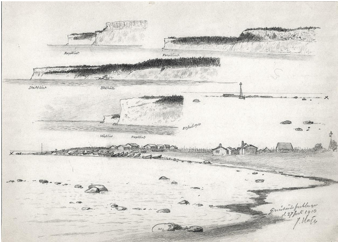
Gnisvärd fiskeläge tecknat från sydväst. Jacob Hägg 1910. Gotlands Museums arkiv.