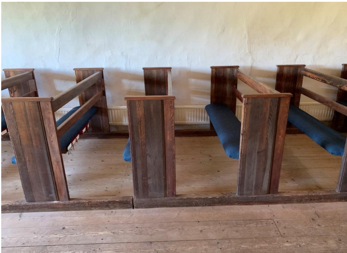
Bänkinredning från 1970. Gavlarna breddade 2001. Foto JL 2020.