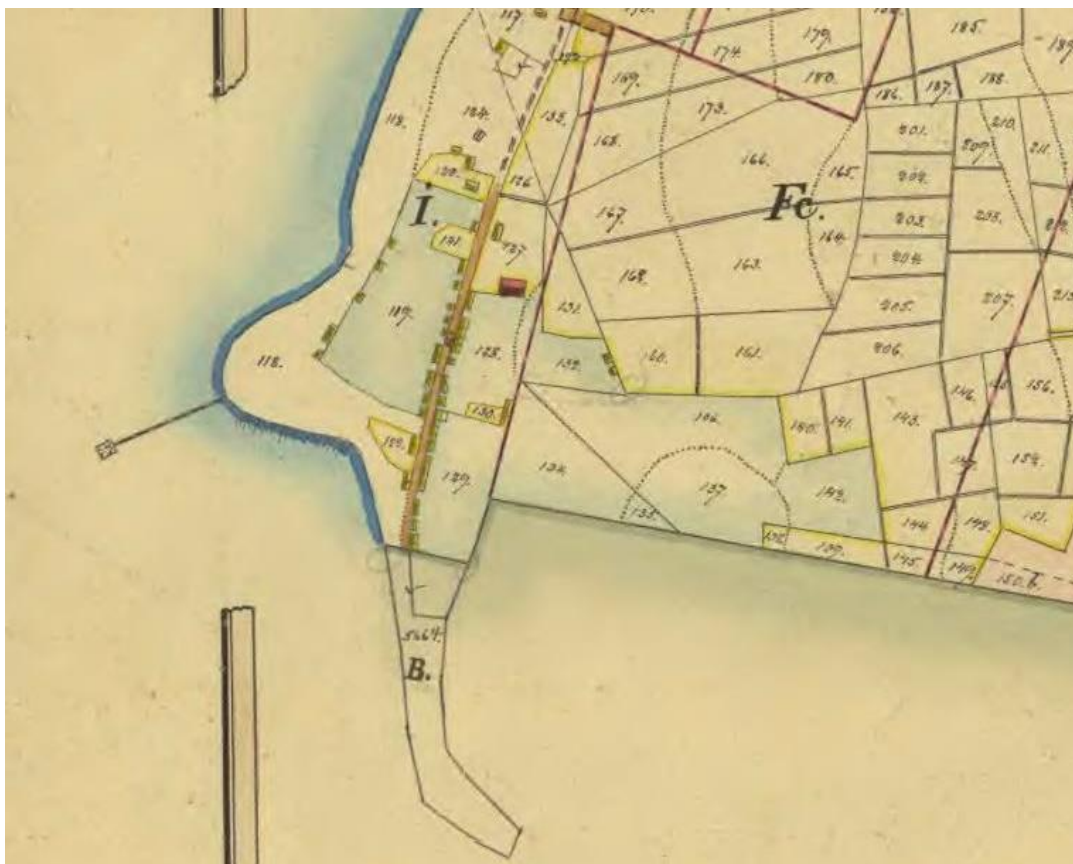
Gnisvärd fiskeläge. Laga skiftes karta 1894. Kapellet är nu markerat med brun färg på kartan.