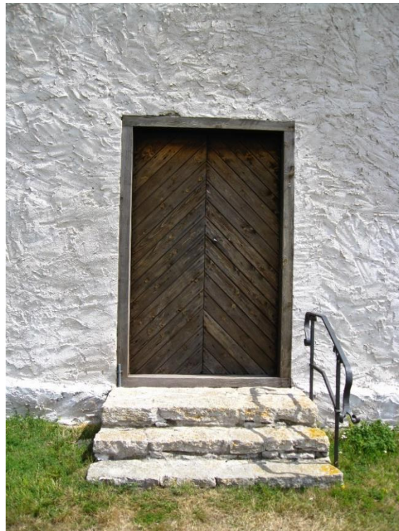
Kapellets ingång. Panelen troligen från 1950-talet. Trappan och räcket, smitt av Mauritz Johansson 2001 och 2018. Till höger samma motiv före 2018 Foto Rebecka Svensson 2008. Visby stift.