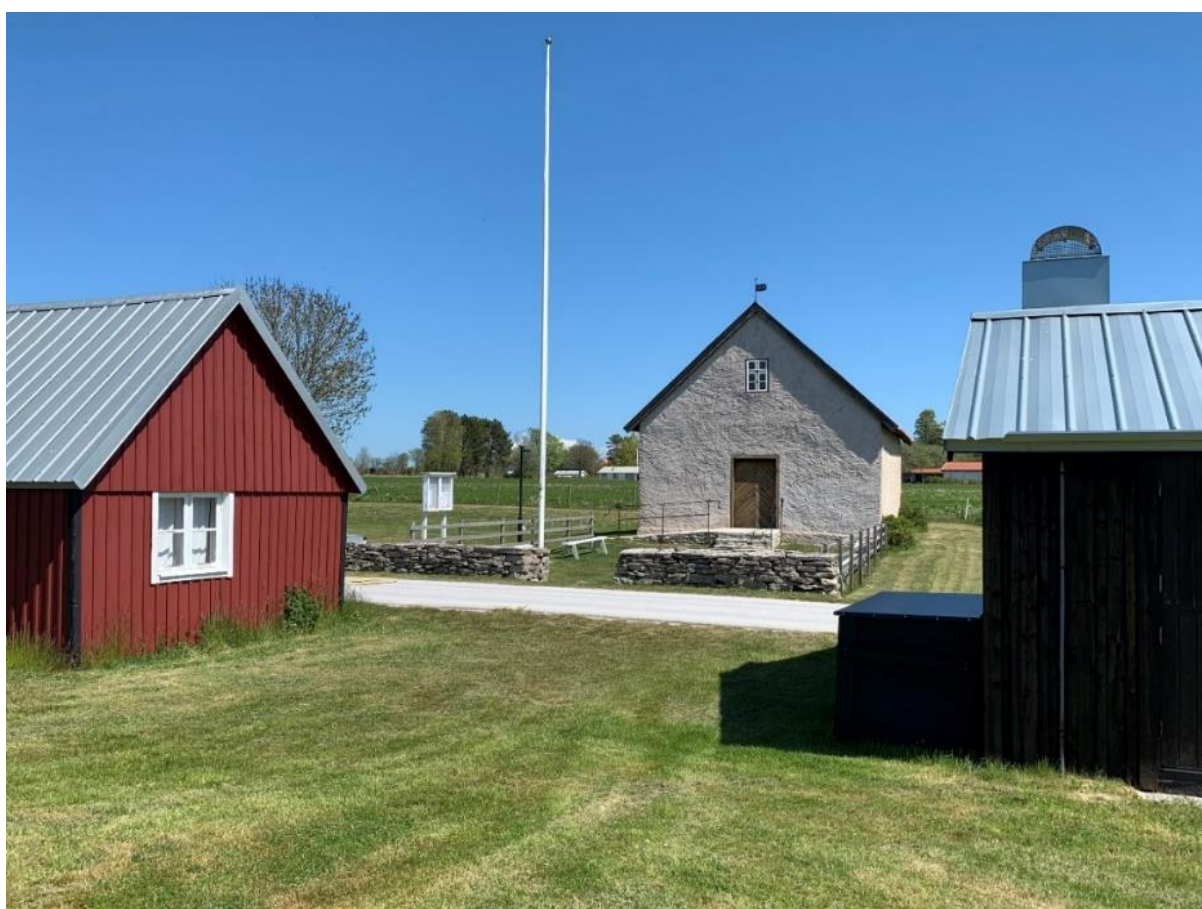
Kapellet från väster.

Väster om kapellet finns en belysningsstolpe.