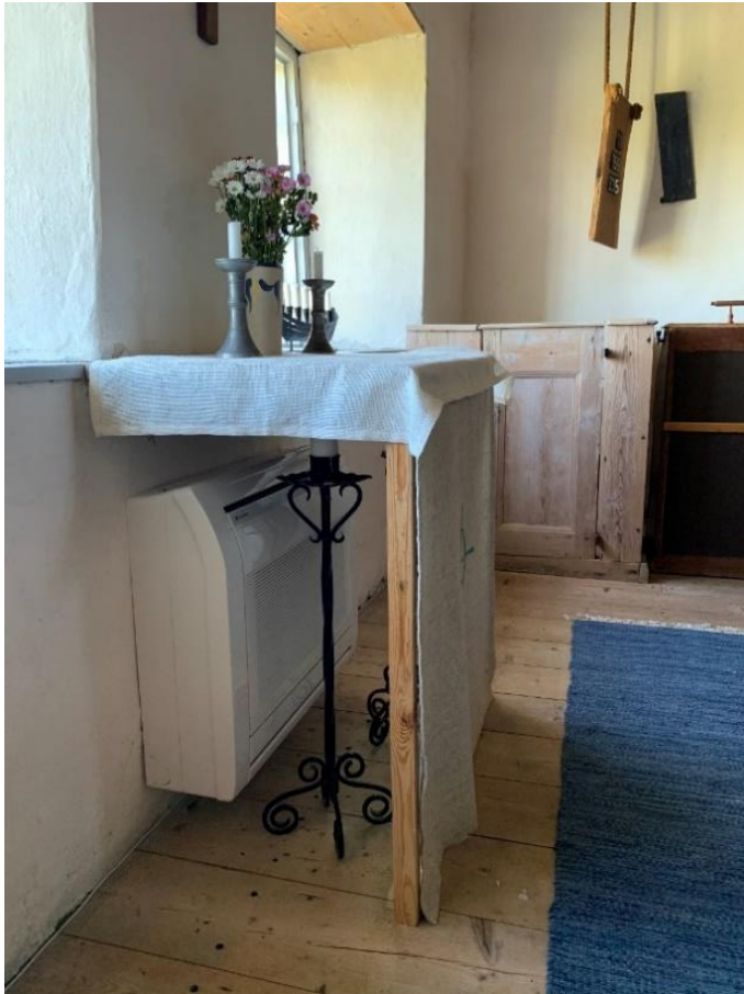
Altaret från norr. Foto JL 2020.