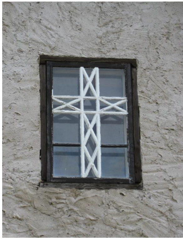
Västgavelns fönster. Till höger samma motiv med tidigare färgsättning. Visby stift.