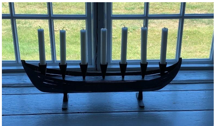
Smidesljusstake. Foto JL 2020.