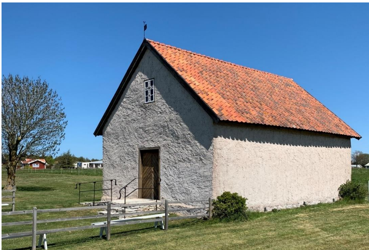
Kapellet från sydväst.