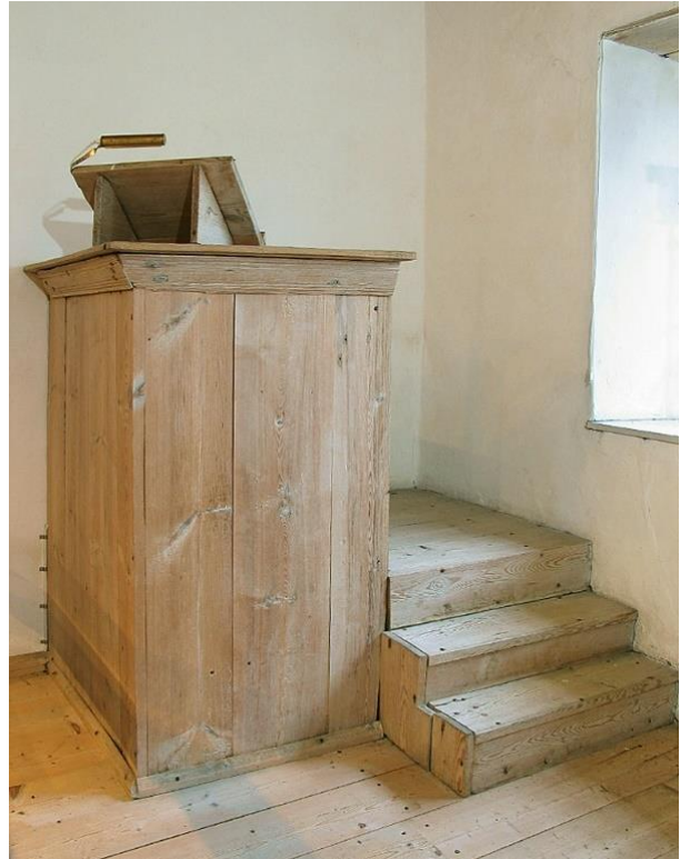
Till vänster: Kapellets nordöstra hörn. Till höger: Predikstolen. Visby stift.