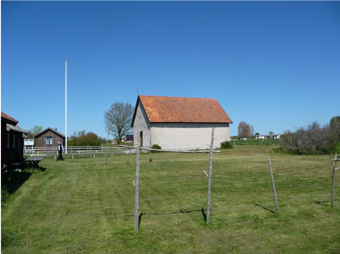
Gnisvård kapell fotograferat från sydväst. Foto ES 2020.