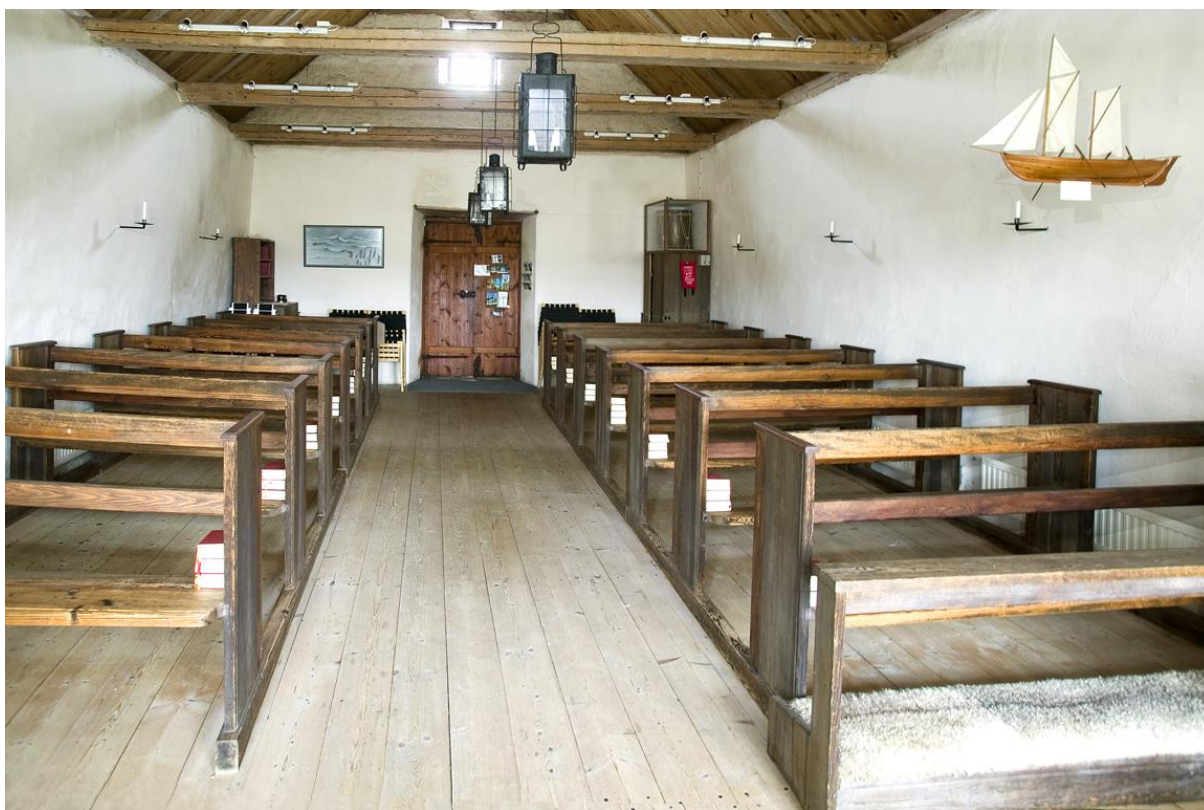
Interiör mot väster. 2004–09. Visby stift.