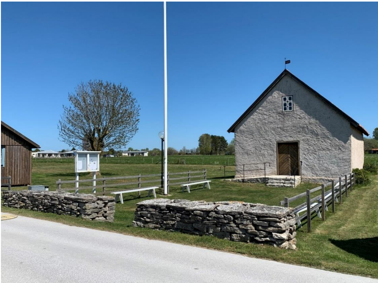
Kapellet och förgården från sydväst.

Gnisvärd kapell, Strandkyrkan, består av en rektangulär huvudkropp, riktad i öst-västlig riktning, täckt av sadeltak. Ingången är mitt på västgaveln. Två fönster på östgaveln flankerar kapellets altare och utgör vid sidan om ett litet fönster i västra gavelröset kapellets enda fönsteröppningar. En inhägnad förplats, tillkommen på 1900-talet, utgör en yttre fortsättning på kapellet. Kyrkliga attribut är sparsamma. I fiskeläget markerar sig kapellet främst genom sin storlek. Invändigt utgör bänkinredningen, altaret och predikstolen markörer som visar på dess kyrkliga funktion tillsammans med den resning som bildas i rummet med dess öppna takstol.