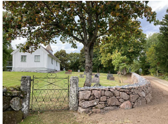
Stenvallen efter omläggningen