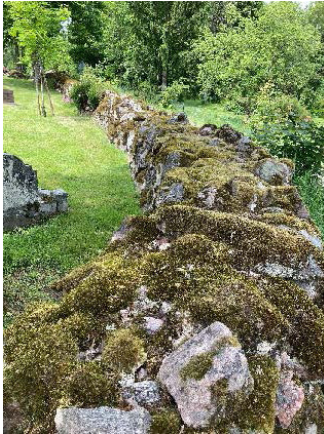
Stenvallen innan omläggningen

Landa kyrka är en liten träkyrka och dess kyrkogård bedöms stamma från 1600-talet. Kyrkan står på en låg muromgärdad kulle och kyrkogården inhägnas med kallmur av rundade naturstenar.