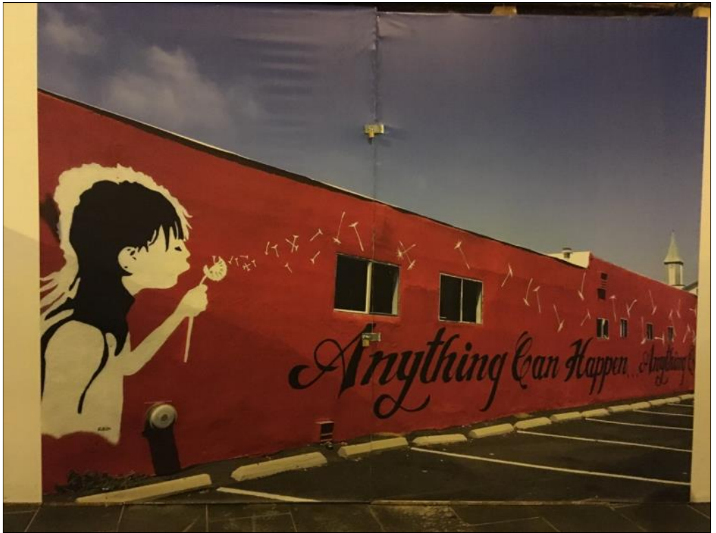
"Anything can happen" Fotot tog jag för några år sen i det underbara Nizza.

den nya dagen med alla handlingar som krävs.