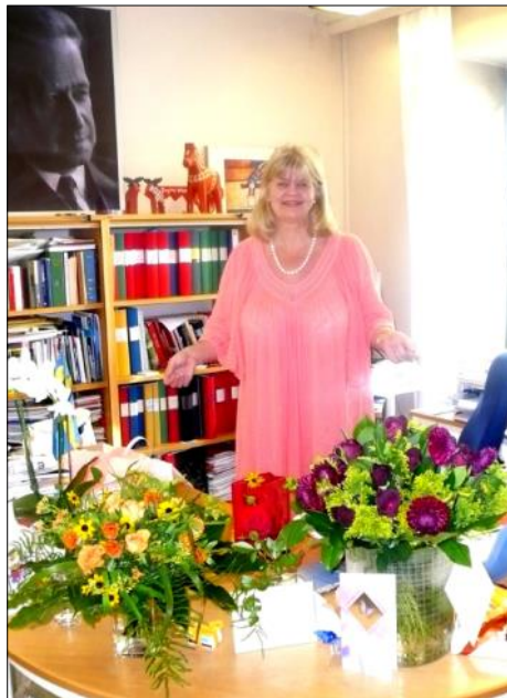
Mitt arbetsrum i september 2008

När generalkonsulatet hade stängts startade jag på nytt – som egen företagare. Med stor livslust och energi. "Om det finns en tro som kan förflytta berg så är det tron på den egna styrkan", sa Freifrau Marie Ebner-Eschenbach en gång i tiden.