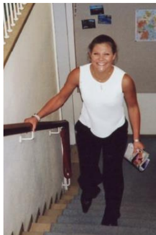
HKH Kronprinsessan Victoria inkognito på besök på generalkonsulatet den 20 september 2002

Denna tro har burit mig under lång tid, gett mig glädje men även insikt om att tillit i andra tyvärr också kan missbrukas. Ändå måste jag konstatera: det var bra att börja om på nytt!