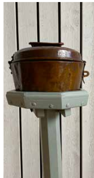
Fattigbössan snart på plats i kyrkan igen.