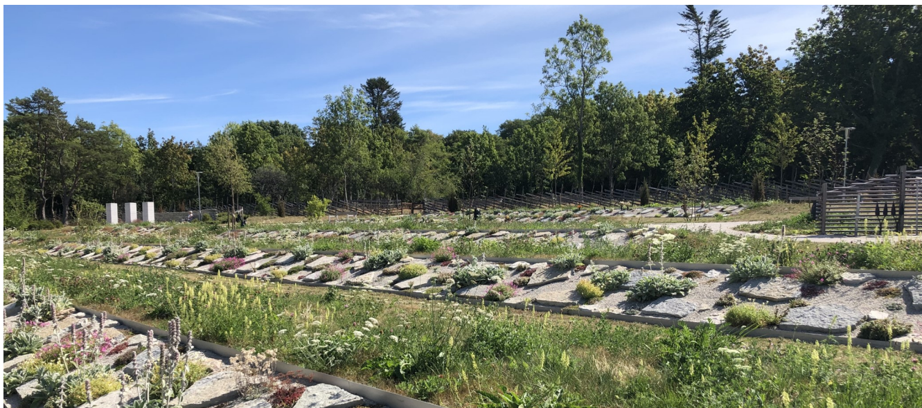
Askgravs område på Ängskyrkogården, Visby Norra kyrkogård.