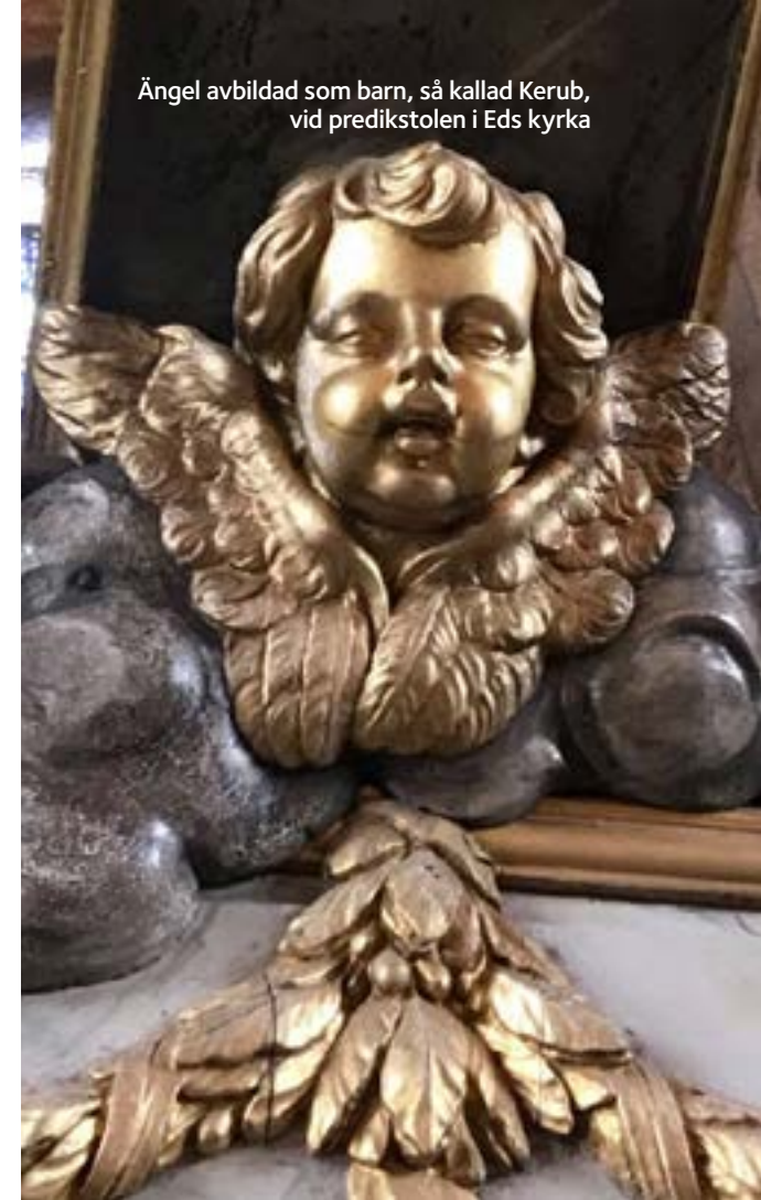
Ängel avbildad som barn, så kallad Kerub, vid predikstolen i Eds kyrka

Tänk om det är så att livet är mer än det vi ser, att det finns en