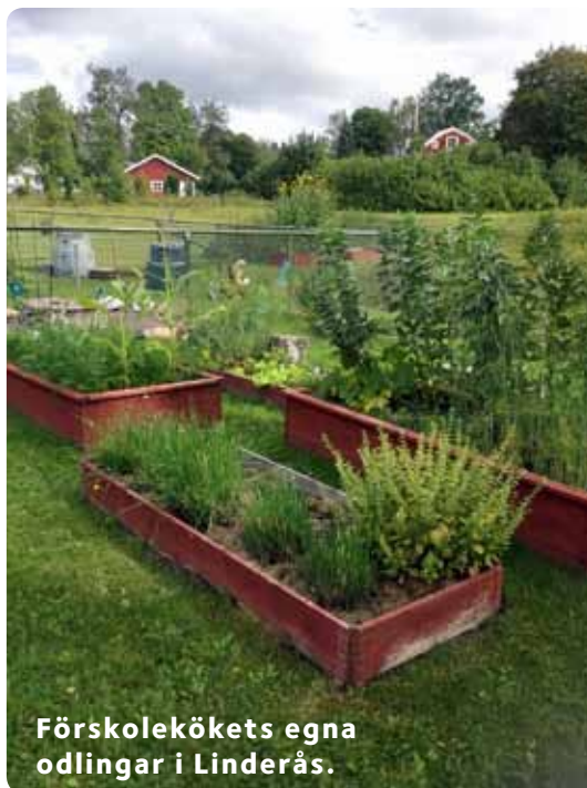
Förskolekökets egna odlingar i Linderås.