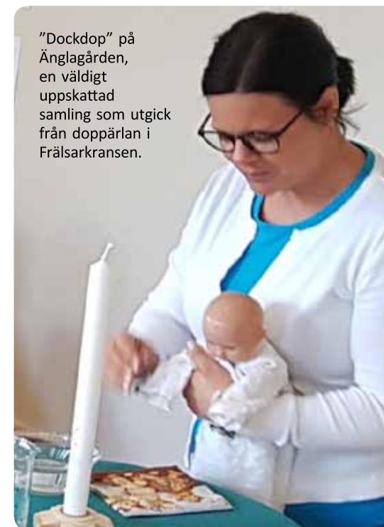
”Dockdop” på Änglagården, en väldigt uppskattad samling som utgick från doppärlan i Frälsarkransen.