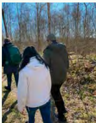
Mot utsiktssudden vid Kärrvägen.