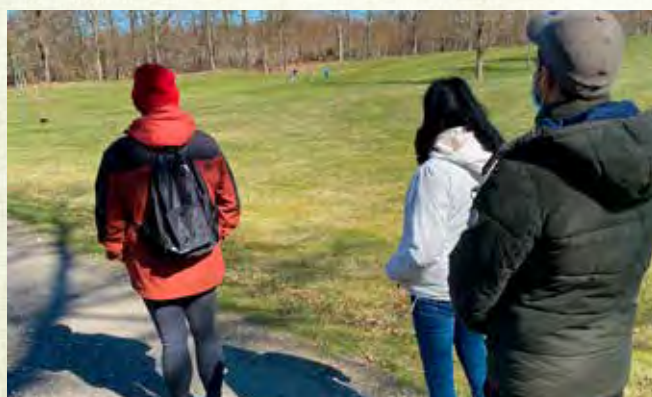
Att korsa golfbanorna kräver konstruktiv dialog med spelare och blick för bollar.