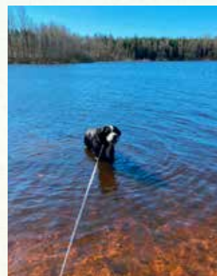
Santiago uppskattade möjligheten till sjöbad.