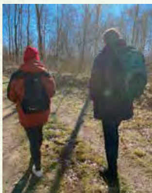
Längs norrsidan av Ybbarpsjön.

Vi har ju skrivit om rundan kring de närmaste sjöarna förut. 23 april tog vi med ett litet gäng på upptäcktsfärd inom några timmars gångavstånd från Perstorp. Kul att få höra kommentarer som: "Oj, så vackert!" "Här har jag aldrig varit förut!" och "Det här är ju inte alls långt hemifrån!"