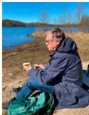
Med Henrikstorpssjön i bakgrunden: Komminister begrundar sina vägval.