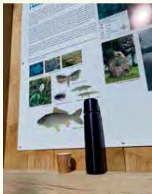
Upplysande skylt vid stranden intill bron mellan Henrikstorpssjön och Tranesjön.