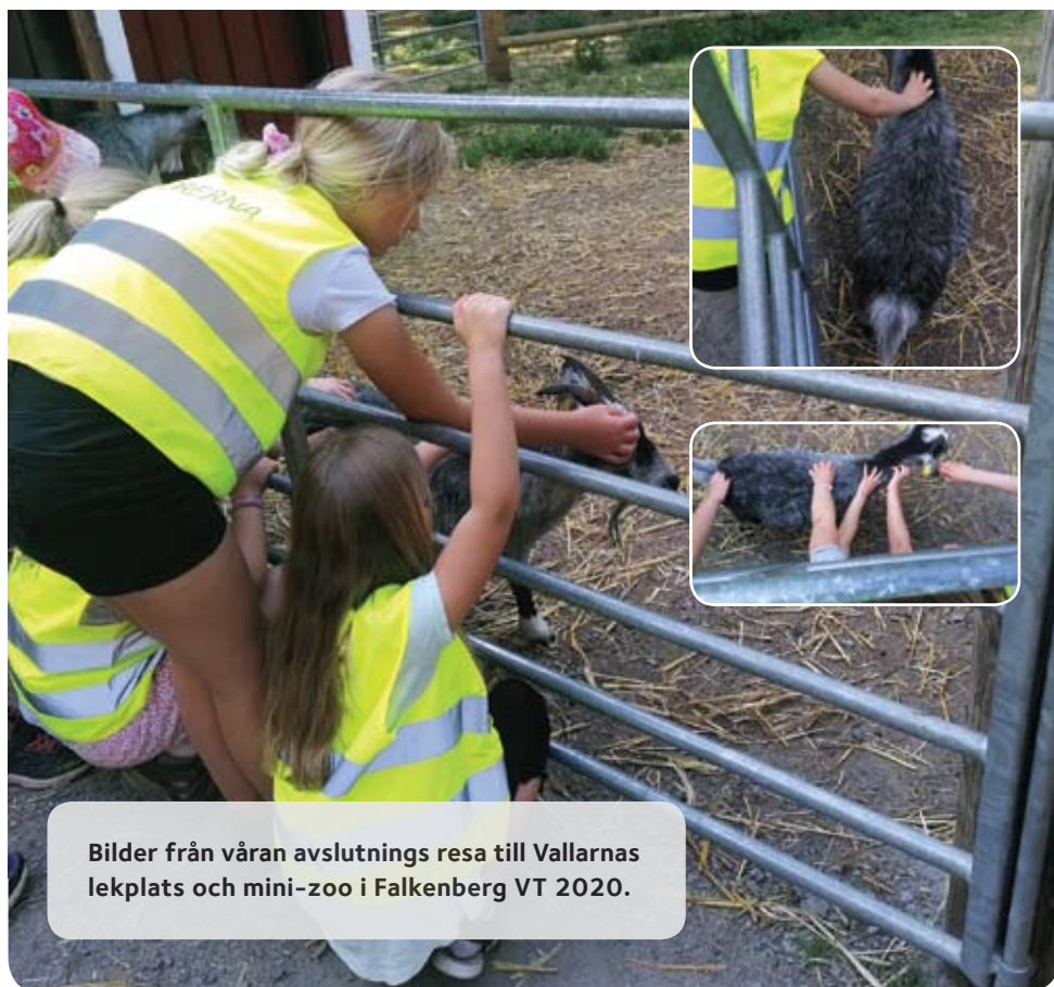
Bilder från våran avslutnings resa till Vallarnas lekplats och mini-zoo i Falkenberg VT 2020.