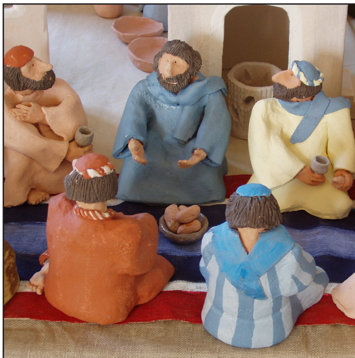
Bild 3: Matt 26:26-29 Jesu sista måltid - Jesus instiftar nattvarden.