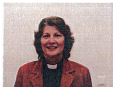
Ronneby i mars 2020

Jag vill rikta ett tack till anställda, förtroendevalda och ideella krafter för ett under året väl genomfört arbete. I och med redovisning på följande sidor lägger vi år 2019 till handlingarna.