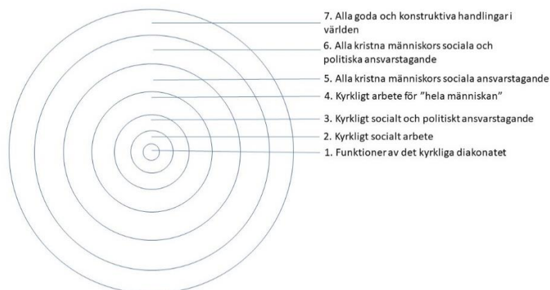
Figur 1: Ett koncentriskt diakonibegrepp.

Några av dessa komplexiteter fångas i Erik Blenningers ”koncentriska diakonibegrepp”, som han beskriver som ett sätt att samordna definitionsförslag för diakoni, från en snäv diakonibestämmning till ett allt vidare begreppsomfång. 14