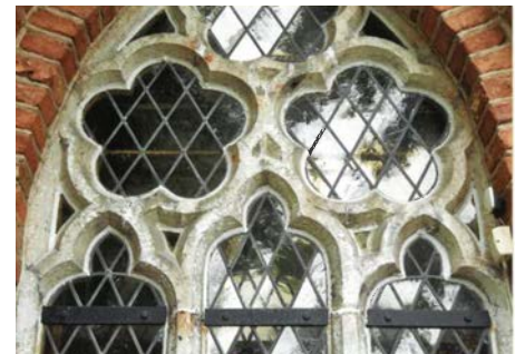
Exempel på kalkstensram (masverk) från Håtuna kyrka