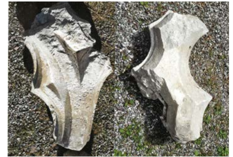
En fönsterdetalj från Lovö kyrka Fr v: utsida och insida

Av södra fasadens fönster tillkom de tre östligaste 1675–76 i samband med kyrkans modernisering och gravkorets tillkomst. Samtidigt som vapenhuset revs under 1790-talet upptogs ytterligare ett fönster, mot väster. Vid samma tidpunkt försågs norra långhusväggen med ett fönster mot väster. De två övriga tillkom först 1801.