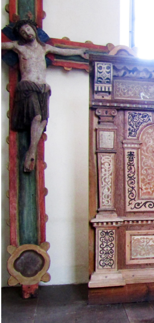
Den medeltida kyrkans gamla predikstol ska ha tillkommit

Altartavlan, med sin centrala position, förklarar hur kyrkans rum är tänkt att uppfattas. Jesus Kristus är huvudpersonen, han som innan sin himmelsfärd sa till de som samlats: "Jag är med er alla dagar till tidens slut". På hans ena sida finns Maria, hans mamma, tillsammans med de kvinnor, Salome och Maria från Magdala, som gick till graven för att göra iordning kroppen men som kom att träffa den uppståndne Jesus och fick uppdraget att sprida den glada nyheten till de andra lärjungarna. På den andra sidan är Johannes, lärjungen. Johannes