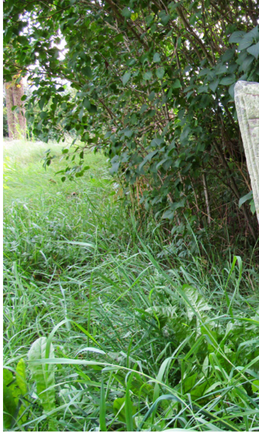
På den gamla övergivna kyrkogården står en del äldre vårdar av sten. På denna finns

I dag finns den gamla kyrkogårdsmuren bevarad och inne på den övergivna kyrkogården står en