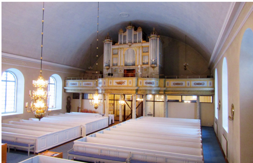
Orgeln av Sven Nordström färdigställdes 1856 och är ovanligt välbevarad. I sen tid har en mindre gudstjänstlokal ordnats under läktaren, den kallas Thelins kapell efter en donator.

pågick. Ett omfattande arbete för församlingsborna var också att ta fram byggnadsmaterial som sten och timmer och att transportera detta till byggnadsplatsen.