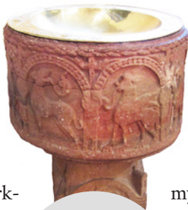
Dopfunten från 1100-talet har en riklig reliefdekor och tillhör den så kallade Bestiariusgruppen.

plats användes oftast ett enklare så kallat sockenbudstyg. I Flisby är detta tillverkat 1790 av tenn. Kalcken och paten förvaras i ett svarvat etui av trä.