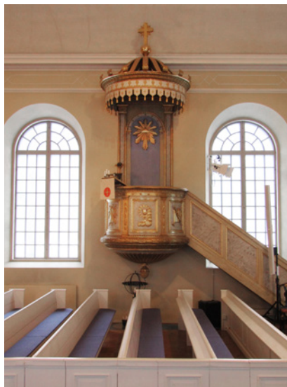
Predikstolen var ursprungligen målad i gråvitt och försedd med förgyllningar.

koncentrera sig mer på måleriet. Under dessa år utförde han flera altartavlor, exempelvis för kyrkorna i Östra Vingåker (1839), Lerbo (1840), Skedevi (1844), Ödeshög (1857), Flisby (1857) och möjligen också Sköldinge.