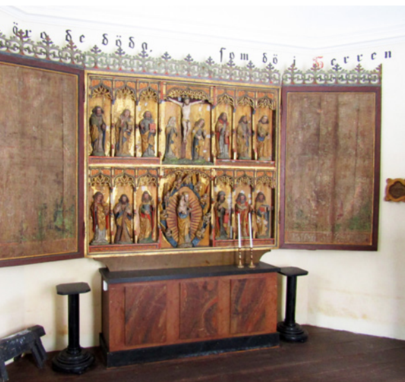
Altarskåpet, som står i gravkapellet, har daterats till 1400-talets senare del och har Maria och Jesusbarnet som centralt motiv.