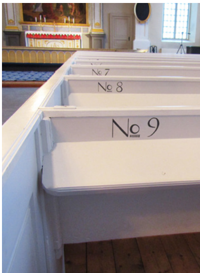
Numreringen av kyrkbänkarna i Flisby kyrka är lite ovanlig genom att siffrorna är placerade vid psalmbokshyllan.

Kyrkorummets predikstol är samtida med kyrkan och den är ett arbete av snickargesällen A Stridsberg från Söderköping. På predikstols-