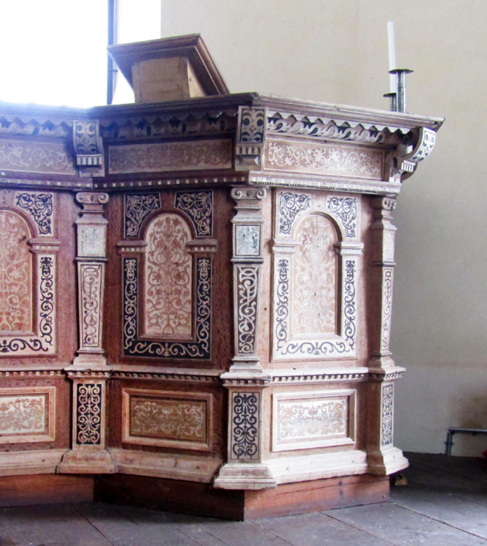
1642. Hela ytan är dekorerad med intarsia i olika mönster.

Men bildens symbolik stannar inte där. Utan även vi som sitter i bänkarna blir inbjudna till att vara en del av folkmassan som är samlad. I bilden finns de elva lärjungarna utspridda på båda sidor och utanför ramen tar vi som församling över och därigenom bildas en cirkel med Kristus i mitten.