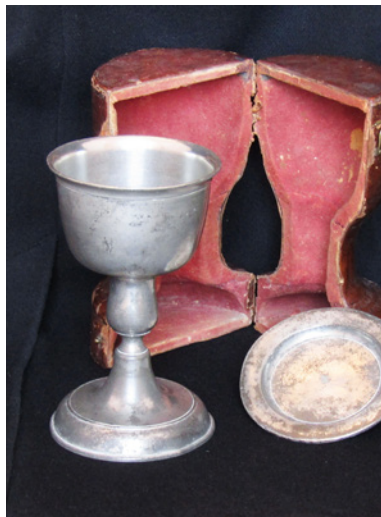
Sockenbudstyget från 1790 kan förvaras i ett behändigt, svarvat etui.

i relief. Den saknar stämplrar, men anses härröra från 1600-talet.