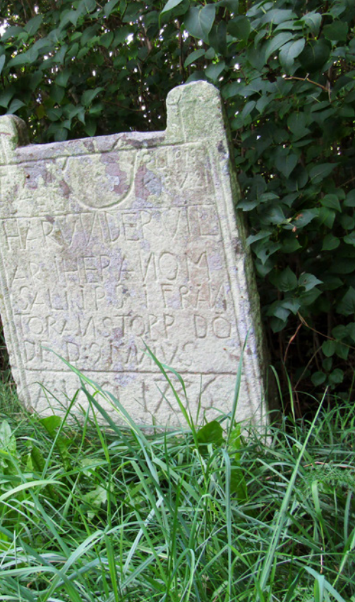
inskriften Här under vilar i Heranom Sali IPS ifrån Toranstorp döde d:9 iunius ano 1736.

Nära ingången till kyrkogården står en gravsten från 1736.