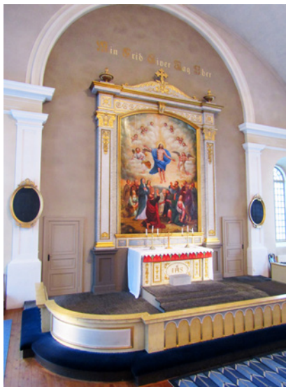
Altartavlan med motivet Kristi himmelfärd, av konstnären Gustaf Adolf Engman 1857.

Flisby kyrka har inte genomgått så stora förändringar. Exteriören är välbevarad, men från början hade kyrkan spåntak. Invändigt har en mindre gudstjänstlokal eller lillkyrka tillkommit under läktaren.