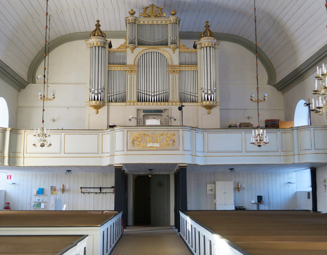
Orgeln från 1863 byggdes av bröderna Nordström. Läktarunderbyggnaden tillkom på 1950-talet.

beslutade man att återanvända timret från Nykyrkan och såga upp det i lämpliga dimensioner. Inköp av bly och glas tyder på att de nya fönstren skulle förses med blyspröjs. År 1784 skrevs kontrakt med byggmästare Caspar Seurling från Mjölby, som vid den här tiden ofta anlätades till kyrkbyggen.