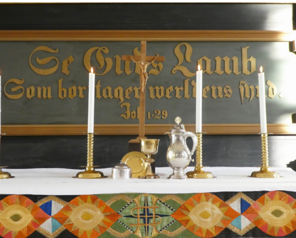
Altaret med delar av nattvardsservisen. Kalkens fot är medeltida medan cuppan är förstorad på 1700-talet.