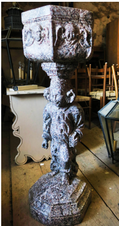
Kyrkans gamla dopfunt förvaras i en tornkammare. Troligen är den tillverkad i den Wernerska verkstaden i Östra Tollstad, 1600-tal.