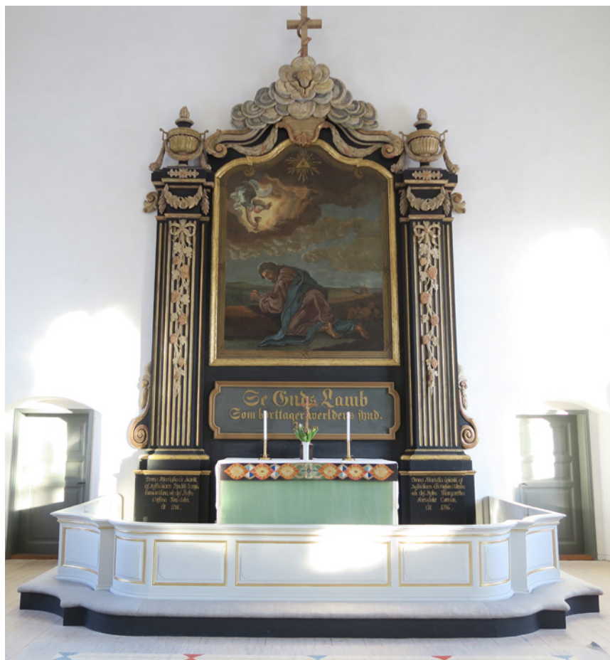
Altartavlan med motivet Kristus i Getsemane.

tus i Getsemane, målad av konstnären Johan Blackstadius som målat ett antal altartavlor, bland annat i Varv-Styra kyrka i Motåla kommun. Vid restaureringen 1955 tog en konservator fram den underliggande 1700-talsmålningen som bedömdes ha en högre konstnärlig kvalitet. Altartavlans omfattning har huvudsakligen