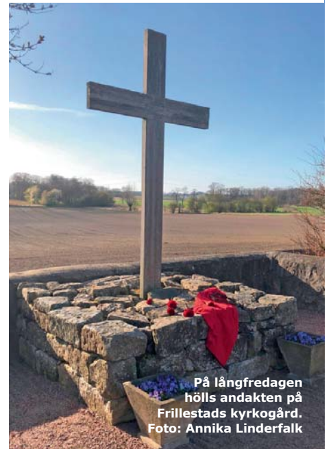
På långfredagen hölls andakten på Frillestads kyrkogård.