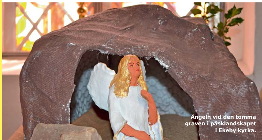
Ängeln vid den tomma graven i påsklandskapet i Ekeby kyrka.