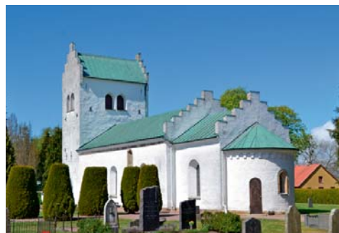
I Mörap ligger kyrkan mitt i byn.