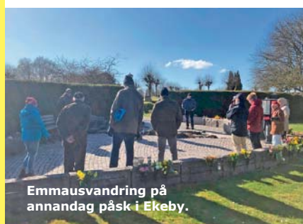
Emmausvandring på annandag påsk i Ekeby.