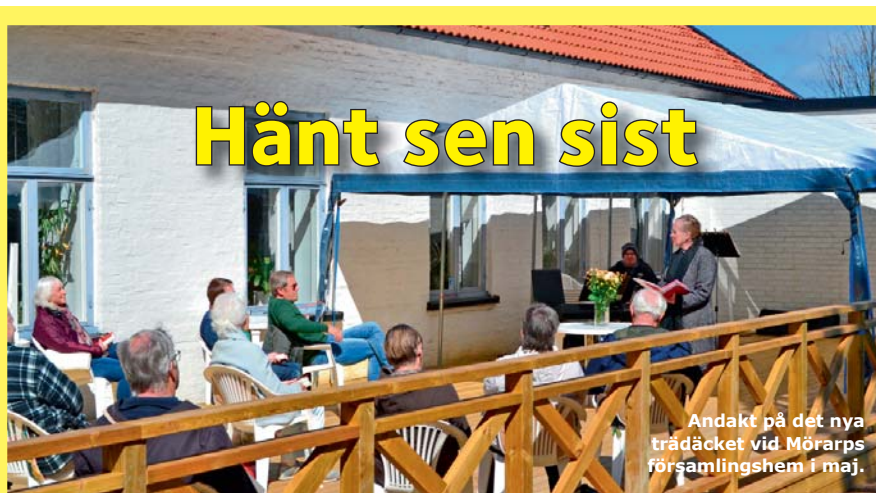
Andakt på det nya trädäcket vid Mörarps församlingshem i maj.