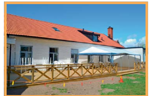
Vaktmästarna har byggt ett trädäck i Mörap.