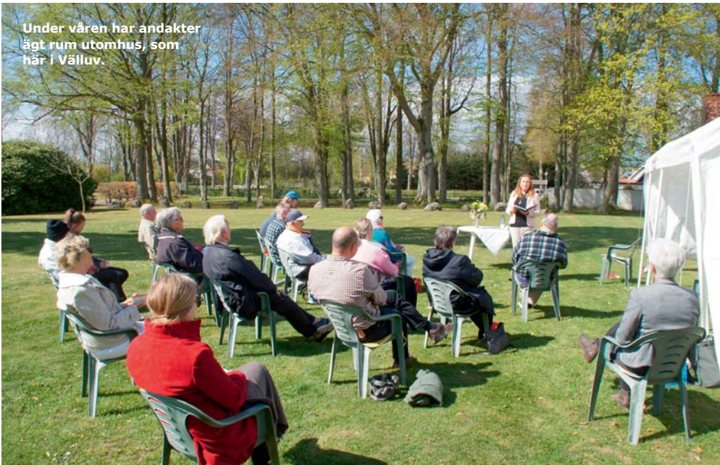
Under våren har andakter ägt rum utomhus, som här i Välluv.