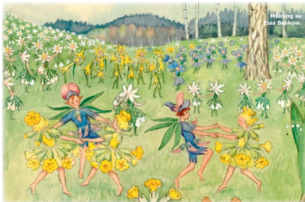
Målning av Elsa Beskow.