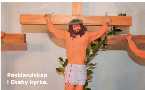
Påsklandskapet i Ekeby kyrka.