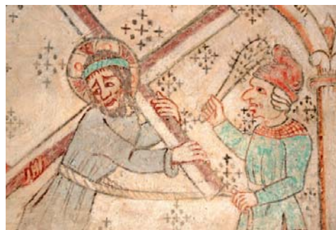
Jesus bär korset på denna kalkmålning i Hemse.