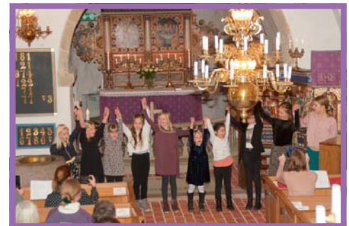
Barnkörererna sjöng i Välluvs kyrka i februari.