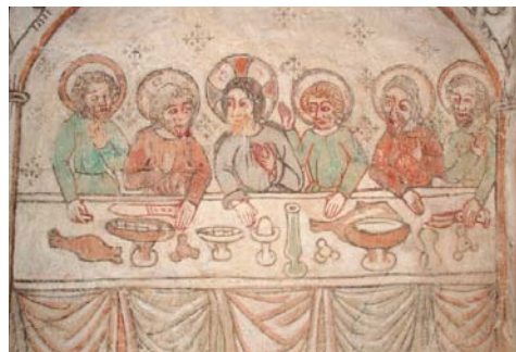
1400-talsmålningar i Hemse kyrka på Gotland.