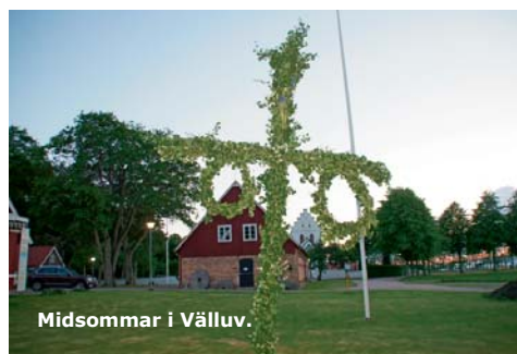
Midsommar i Välluv.