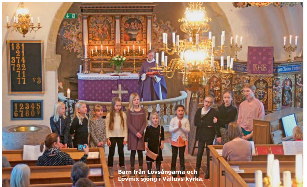
Barn från Lövsångarna och Lövmix sjöng i Välluvs kyrka.