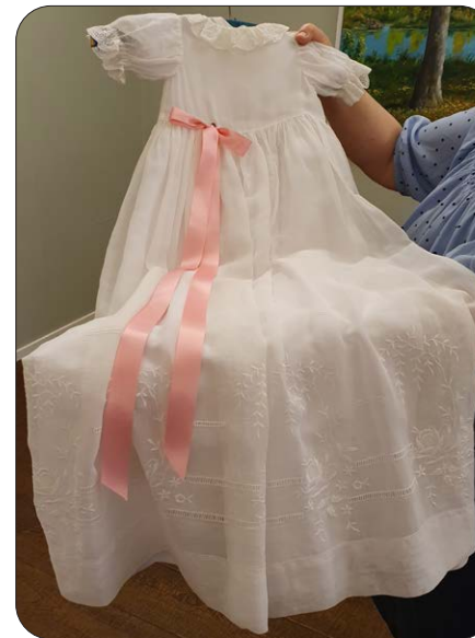
Ovan: Den äldsta dopklänningen från 1929.

Dessa fina dopklänningar har vi haft utställda under januari/februari i Kyrkans hus. Den äldsta klänningen är från 1929. Vackert sydda eller virkade klänningar och alla har sin egen historia. Vissa har många barn döpts i och vissa lite färre. Tusen tack till Er församlingsbor som låtit oss få låna och visa de här klänningarna.