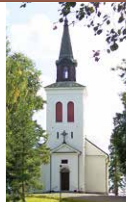
VÄSTRA FÅGELVIKS KYRKA