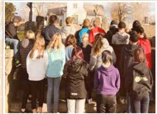
På After school åk 5-6 i Töcksmark pratade vi om Allhelgona, seder och bruk och besökte kyrkogården.