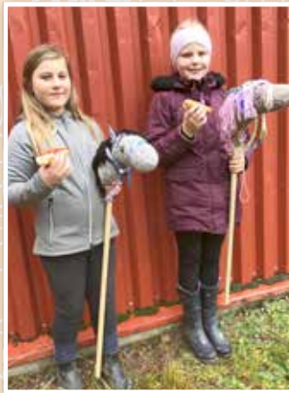
62 käpphästar tillverkades under en dag på höstlovet. Det kom cirka 90 besökare till ridhuset. Ponnyridning, korvgrillning och hopp med käpphästar stod på programmet.