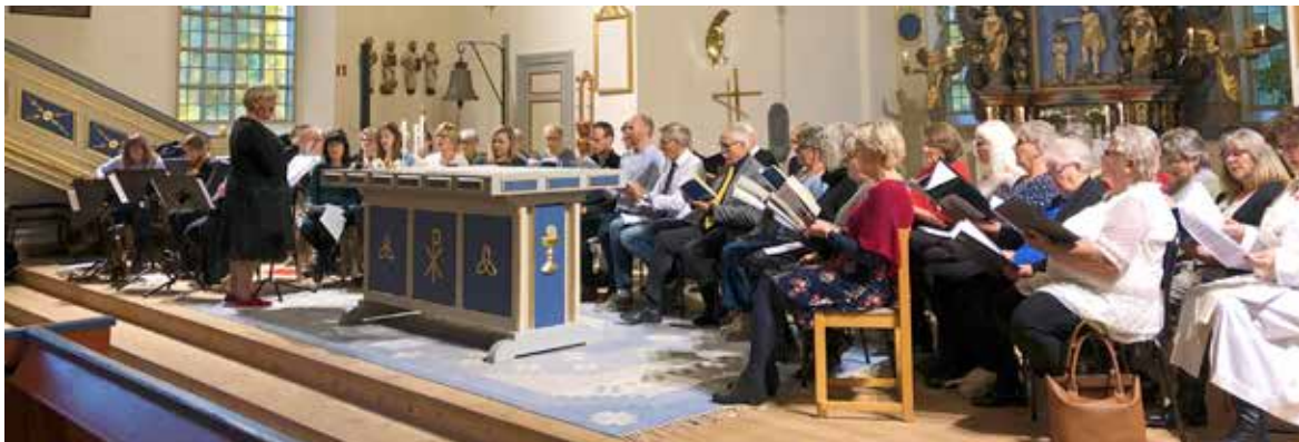
Fräsarkransmässa för hela pastoratet i Holmedals kyrka 29/9. Sång och musik av Con Brio och Silbodals kyrkokör.