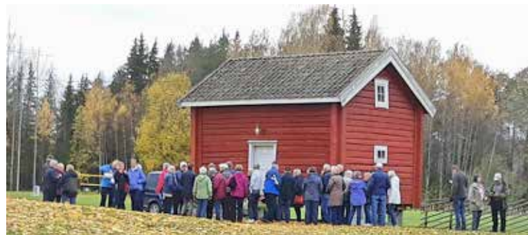
Walk and talks 5-års jubileum. Resa till Römskog tillsammans med "På gång-gänget", Östervallskog.