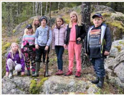
After school i Karlanda på utflykt till jättegrytorna i Hältebyn.