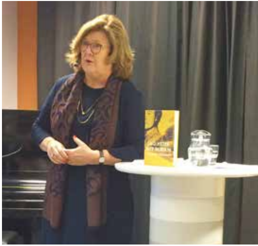
Författarbesök på biblioteket 12/9. Majgull Axelsson berättade om sin bok "Jag heter inte Miriam".

Silleruds och Blomskogs församlingsresa gick i år till Ransby, där vi tittade på Pilgrimstapeten. Lunchen intogs på Strandås Gästgiveri. Resan gick sedan vidare till Ekshärads kyrka.