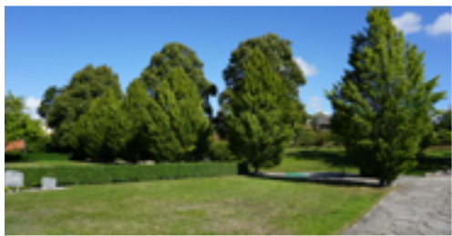
Avenbokarna före beskärning

Efter beskärningen ser ju idag träden rätt märkliga ut men inom kort kommer trädet bryta på nytt och utseendet förändras. Vi tror att detta kommer bli en bra lösning på de uppkomna problem som detta skapat.