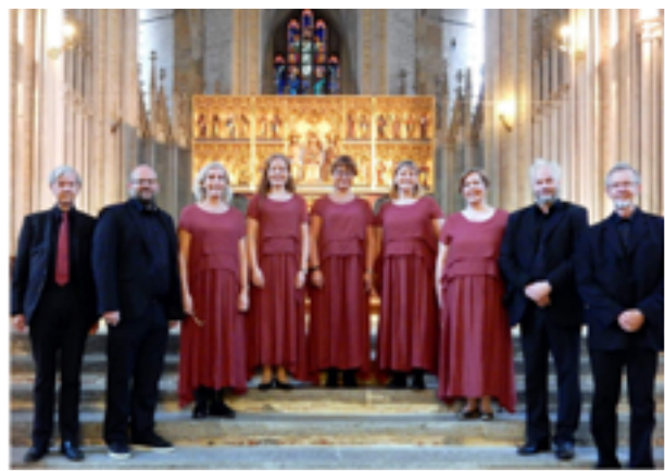
Bach Collegium Småland

kl. 18.00 Musikgudstjänst i Nättraby kyrka. Bach Collegium Småland. T. Biwefors.