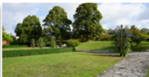
Avenbokarna efter beskärning