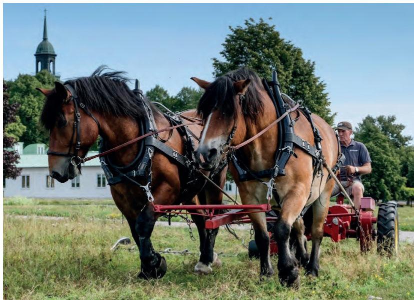
Örter, bin och människor mår bättre när ängarna slås med häst och skär-maskin i stället för bensindrivna slättermaskiner med slaghack.