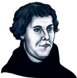
Illustration: Helena Böling

Den 31 oktober 2017 är det 500 år sedan Luther spikade upp sina teser i Wittenberg.