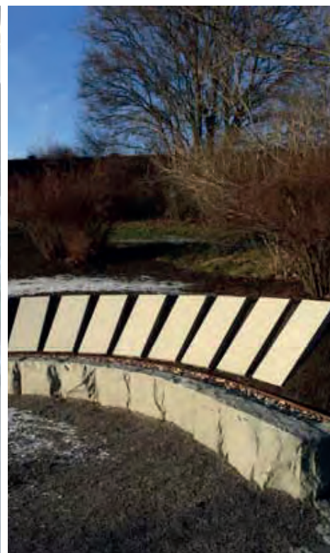
Nya askgravlundan på Sollentuna kyrkogård. På dessa stenar sätts namnbrickor i zink.