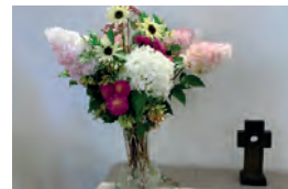
Altarborden har börjat smyckas utifrån en hållbar livshållning.