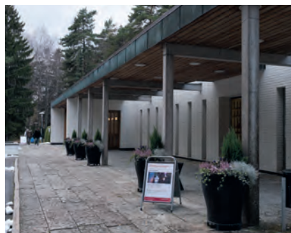
Silverdals krematorium har funnits sedan 1969. Den 9 februari i år gjorde krematoriet sin 80 000:e kremering. Det var en Sollentunabo som ska gravsättas på Silverdals griftegård. I samband med allhelgonahelgen har krematoriet öppet hus så allmänheten kan komma på besök.