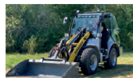
Grävmaskiner och hjullastare går på biodiesel.