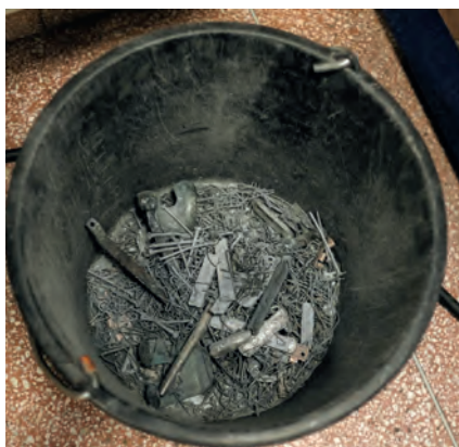
Pengarna som kommer in från metallåtervinningen går till Allmänna arvsfonden.