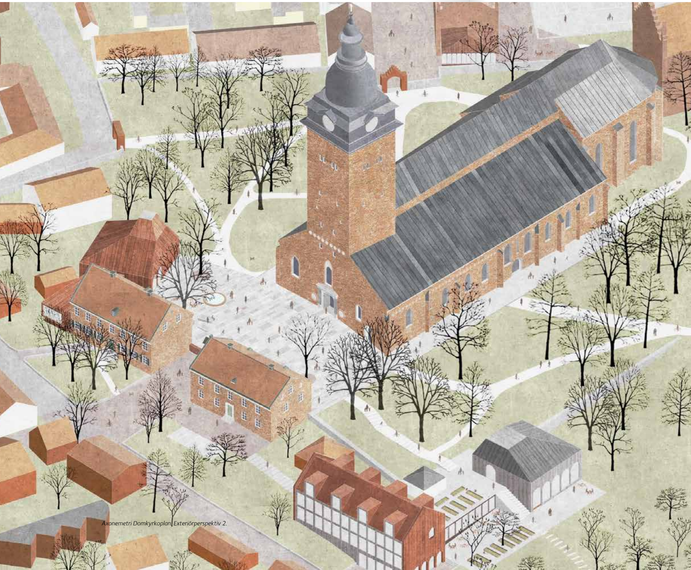
Axonometri Domkyrkoplan | Exteriörperspektiv 2.