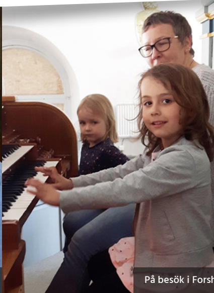
På besök i Forsheda kyrka.