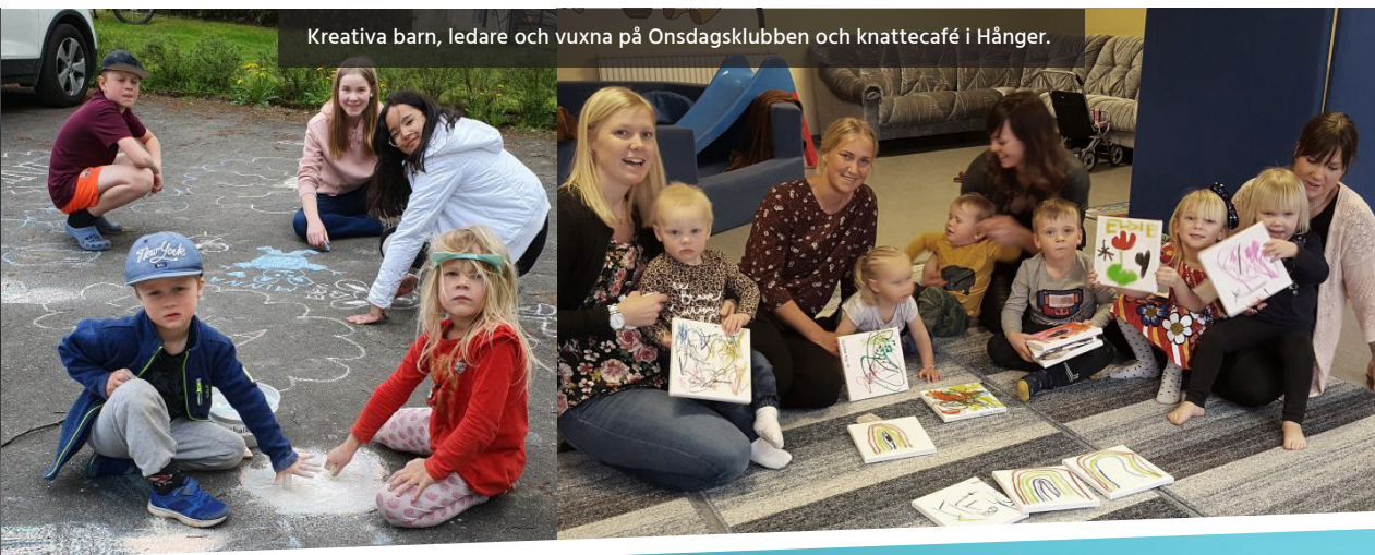
Kreativa barn, ledare och vuxna på Onsdagsklubben och knattecafé i Hånger.