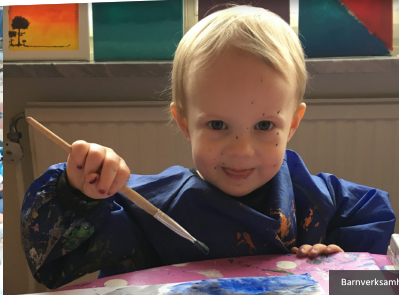
Barnverksamhet i Forsheda