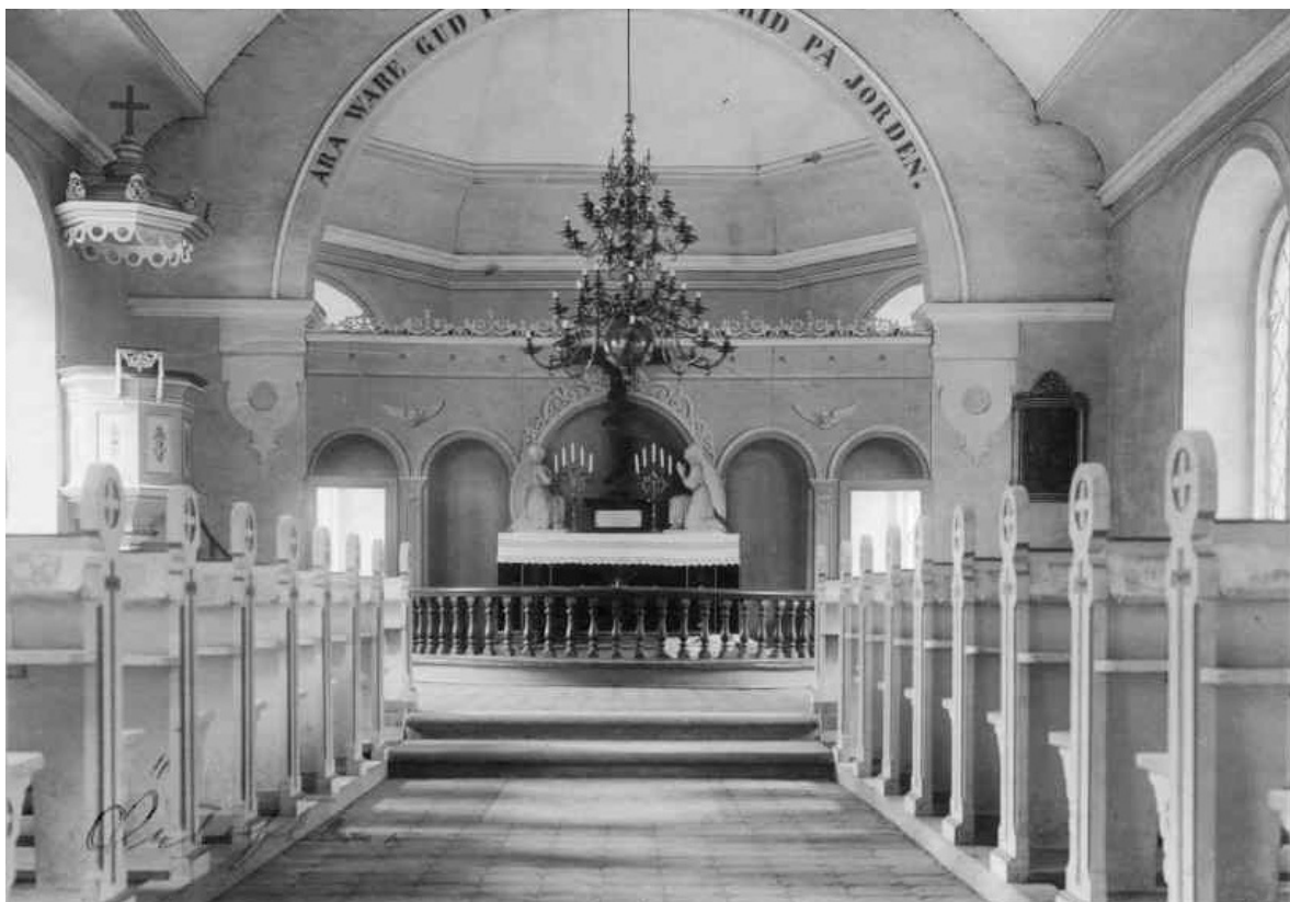
Koret innan 1927.

Årtalet 1639 som än idag står skrivet på den västra tornfasaden markerar tidpunkten för en ombyggnad, vilken troligen rörde höjning av tornet.