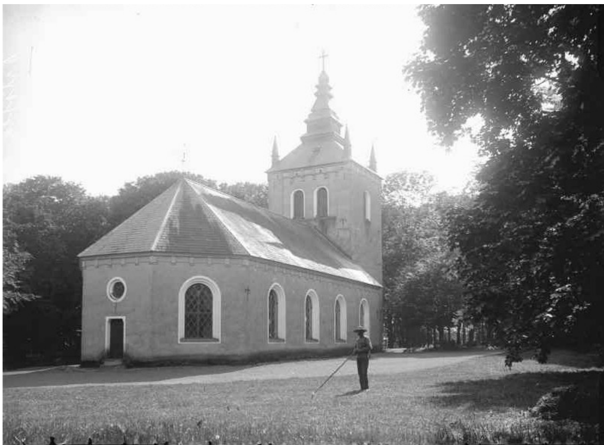
Örtofta kyrka fotograferad från öster någon gång mellan 1904 och 1906. Notera att tornets hörnspiror ännu fanns kvar.

En romansk kyrkobyggnad i sandsten uppfördes i Örtofta redan under 1100- eller 1200-talet. Kyrkan låg där den nuvarande kyrkan ligger men var betydligt mindre med långhus med smalare rakslutat kor åt öster. Korets östra vägg slutade strax innan den nuvarande kortrappans början. Under senare medeltid tillkom tornet och ett vapenhus intill långhusets södra sida. Av den medeltida kyrkan återstår idag enbart grundmurarna och delar av tornet. Vid en arkeologisk undersökning 1953 påträffades en sandstenskvader med ett stenhuggarmärke som tillhörde "Mästaren med korstriangeln". Stenen är idag placerad utomhus vid långhusets nordvästra hörn.