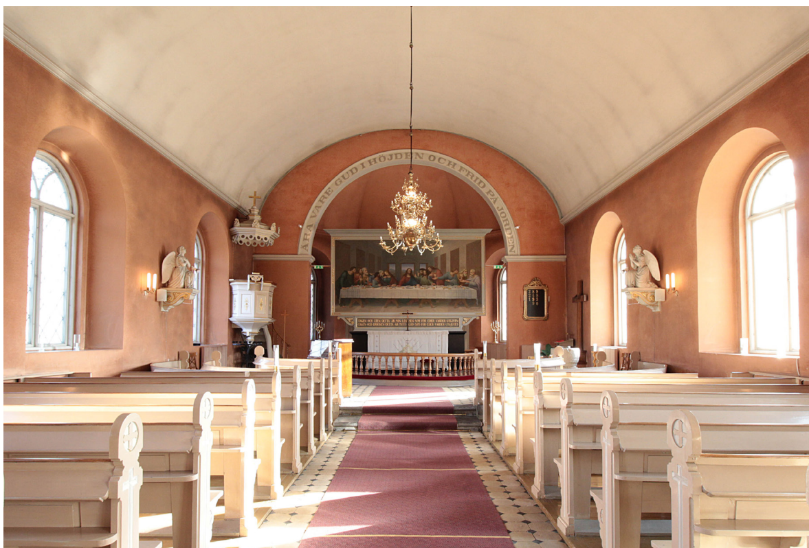
Kyrkorummet sett åt öster.

finns en modern spiraltrappa som förbinder vapenhuset med klockvåning och vindar. En småpröjsad pardörr med lunettformat överljus leder in till kyrkorummet.