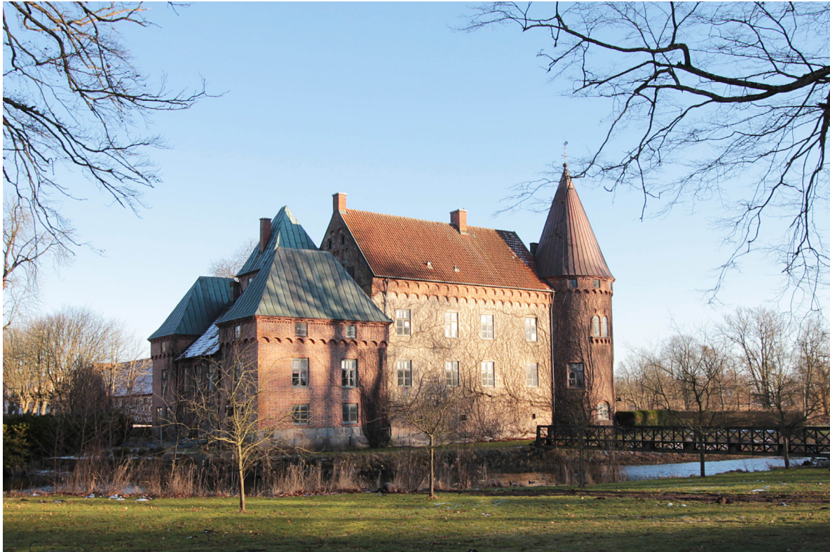
Örtofta slott restaurerades i mitten av 1800-talet av den danske arkitekten Ferdinand Meldahl i fransk renässansstil.

Ingen vet emellertid längre var den medeltida tingsplatsen låg. Utöver sitt juridiska inflytande var godset också en stor fastighetsägare. Under 1500-talet tillhörde 23 av socknens 25 gårdar säteriet, och vid 1600-talets slut förfogade godsherren över socknens samtliga gårdar.