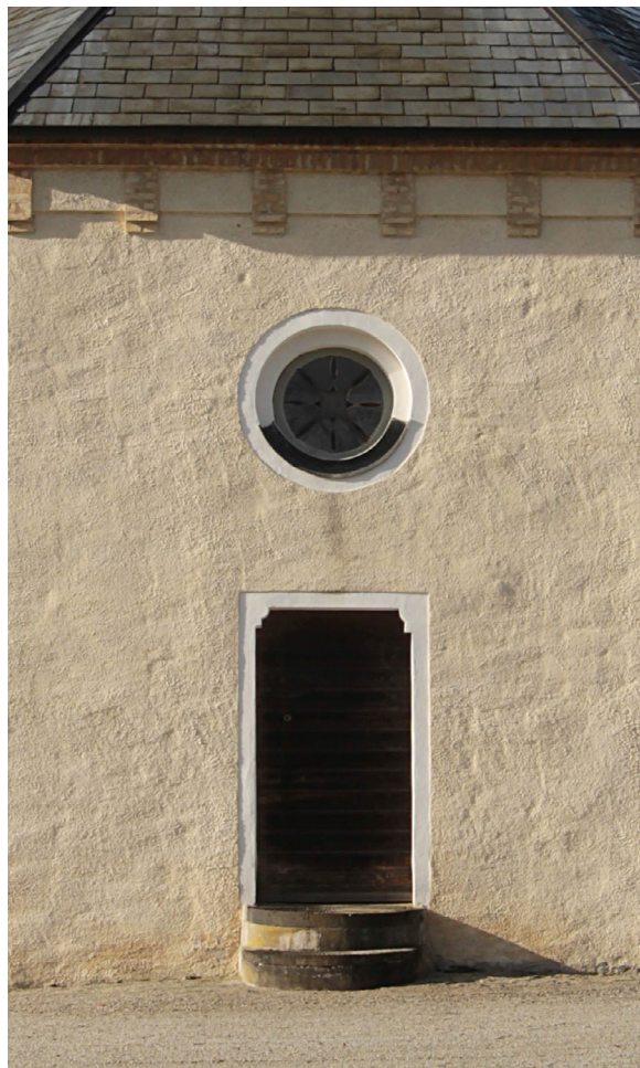
Prästingången i öster leder in till sakristian.

Tornets nedre del domineras av den basilikalt utformade västportalen i oputsat gult tegel. Över ingången sitter ett runt fönster och strax över portalen en minnessten över den stora ombyggnaden 1862. Klockvåningen har två ljudöppningar åt öster och väster och en åt norr och söder. Luckorna består av liggande grönmålade brädor. Västfasadens ankarlutar bildar årtalet 1639, tidpunkten för en tidigare ombyggnaden av tornet.