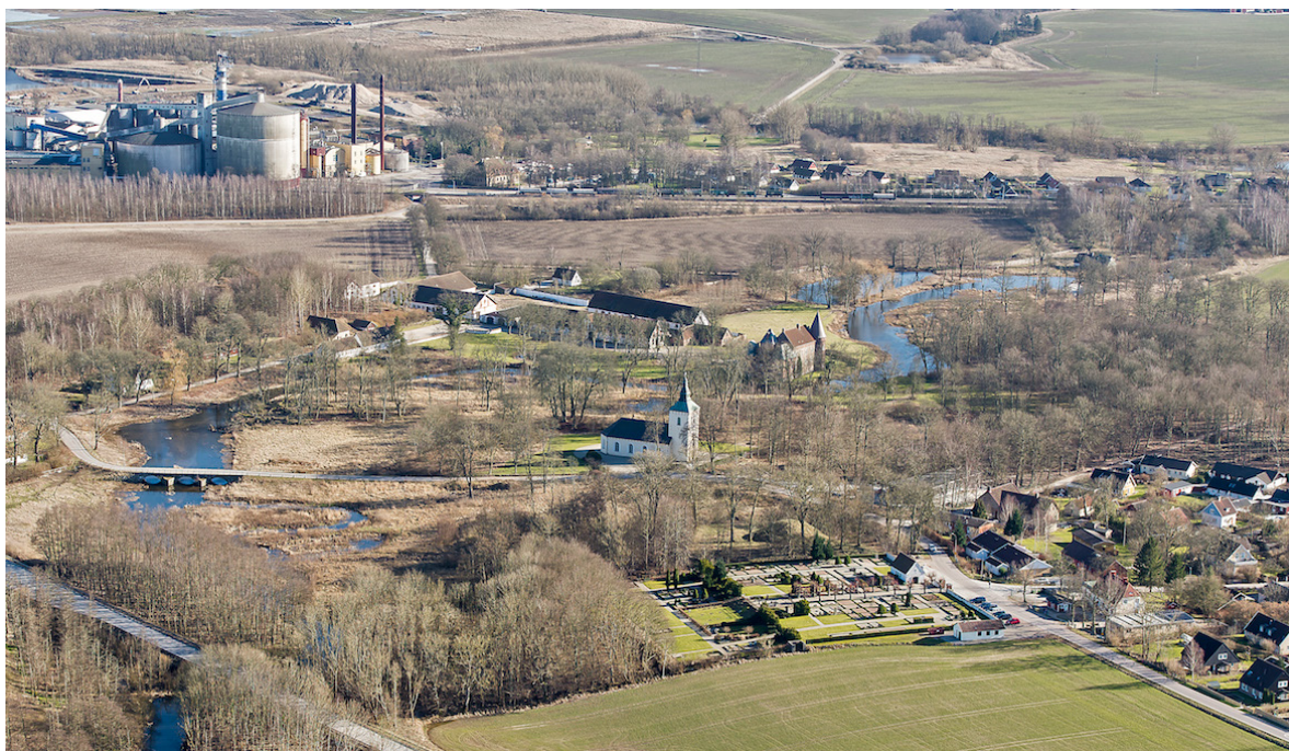
Flygbild över Örtofta tagen från norr, 2014. I bildens övre vänstra kant syns Örtofta sockerbruk, i dess mitt kyrkan och kyrkogården, och strax bakom Örtofta slott med ekonomibygnader.

Örtofta säteri har medeltida anor, och den äldste kände godsägaren är Trugot Has som skrev sig till "Yrtofta" 1380. Först under slutet av 1400-talet uppfördes en försvarsborg, strategiskt placerad intill ån. Delar av borgen ingår ännu i slottets murar. Vid medeltidens slut och under 1500- och 1600-talen var Örtofta landskapets enda adliga birk, vilket innebar att godsherrn hade full domrätt över befolkningen i området.