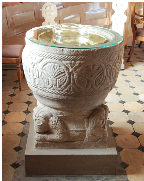
Dopfunten från 1100-talet höggs av Mårten stenmästare.

Bänkinredningen består av öppna bänkar, 15 i långhuset och tre svängda bänkar i koret. Bänkgavlarna är dekorerade med latinska kors och pilformiga grekiska kors placerade i cirklar upptill, båda utförda i försänkt relief. Bänkinredningen ritades av Abraham Pettersson och är bevarade sedan kyrkans nyuppförande 1862.