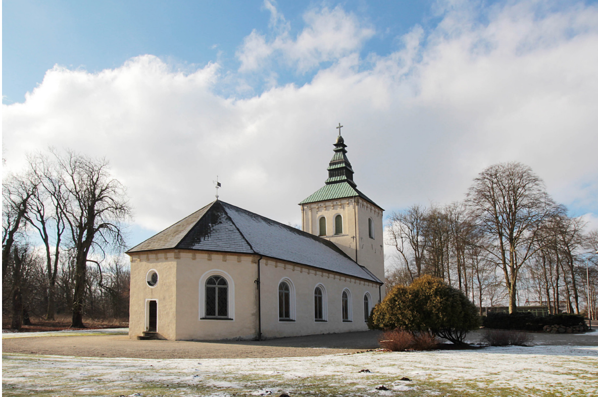
Kyrkan sedd från nordost.