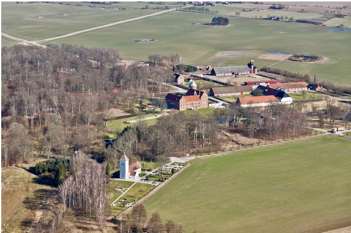
Flygbild över Skarhults kyrka och slott 2014, tagen från sydväst.

Dagens huvudbyggnad uppfördes på 1500-talet och utgörs av en trelängad och tornförsedd borg i rött tegel. Dess trädgårds- och parkanläggning genomskärs av den ringlande Bråån, på vars södra sida kyrkogården angränsar. Vid mitten av 1800-talet ägdes godset av Karl XIV Johan och slottet genomgick då en restaurering under ledning av domkyrkoarkitekten C.G. Brunius. Skarhults by framställs på en avmätningsskarta från