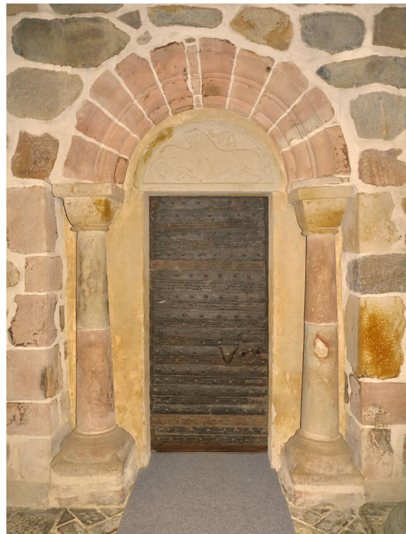
Den romanska sydportalen tillskrivs den så kallade Skarhultsmästaren.

Kyrkans ursprungliga sydportal i grå och röd sandsten består av två fristående kolonner med tärningskapital som ett tympanonfält omgärdat av arkivolter i tre språng. Tympanonfältet i grå sandsten framställer två lejon kämpande lejon som håller ondskan utanför helgedomen. I dörröppningen sitter en medeltida, möjligen ursprunglig, järnmidd och bepansrad dörr. Taket utgörs av ett bräddat tredingstak som tillkom vid restaureringen 1940. Mellan väst- och östväggarna spänner tre grova ekbjälkar. I vapenhuset förvaras kyrkans två medeltida kyrkklockor, en straffstock samt en rad äldre bruksföremål.