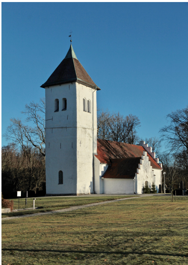
Kyrkan sedd från sydväst.

Sydfasaden har tre fönsteröppningar, en i långhuset och två i koret. Strax under takfotsgesismens syns ankarslutar, vars dragjärn tar upp valvens last på yttermurarna. Fönsteröppningen i korets östfasad är något mindre än kyrkans övriga fönsteröppningar. Östfasaden avslutas upptill med en trappstegsgavel som avtäcks med rött munk-