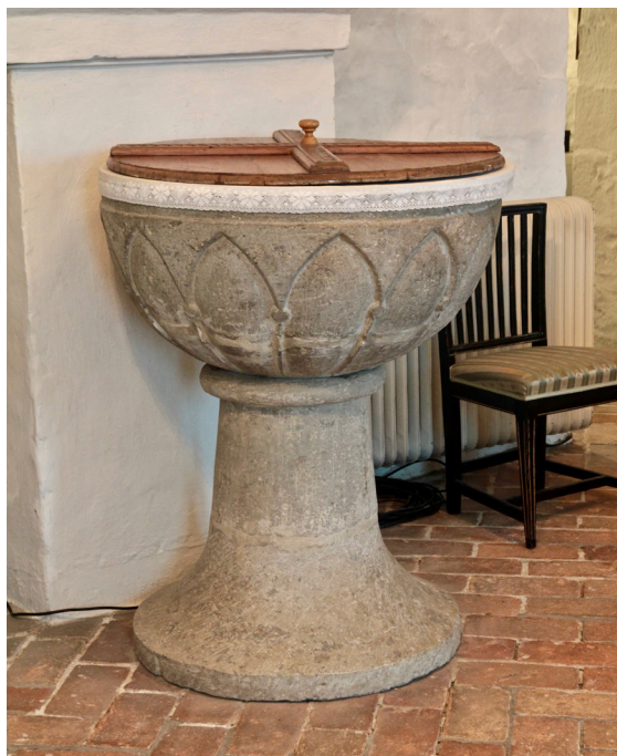
Den medeltida dopfunten är placerad strax väster om ingången till sakristian.

Predikstolen i furu och lövträ tillverkades på 1700-talet av träsnidaren Johan Ullberg från Finja och är placerad i korets sydöstra del mot yttermuren. Den firsidiga korgen med tillhörande trappa bärs upp av en snidad pelare. Korgens och trappbarriärens fältindelningar pryds av blad- och blomsterornamentik i ramverk. Fälten avskiljs av snidade konsoler. Predikstolen är marmorerad i grått och gult med detaljer i förgyllning, blått och svart. Färgsättningen tillkom vid restaureringen 1940 och är en rekonstruktion av den ursprungliga färgsättningen.