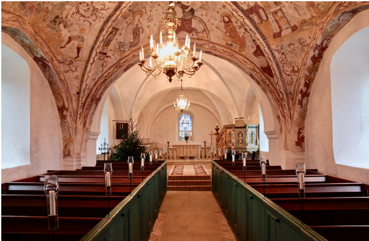
Kyrkorummet mot koret i öster. Den kyrkliga traditionen med kalkmålningar försvann i och med reformationen, och målningarna i Skarhult är några av Skånes yngsta.

Det fullbreda koret i öster spänner över två valvtravéer och är beläget tre trappsteg högre än långhuset. De båda kryssvalven är liksom väggarna vitputsade och har trapetsformade valvribbor och rundbågiga sköldbågar. I den västra travéen pryds valvmitten