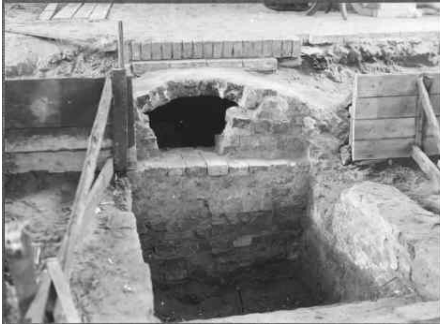
1940 frilades nedgången till gravkoret, som undersöktes och restaurerades.

under ledning av konservator Oswald Oswald. Kyrkorummet återfick på så vis sin senmedeltida prägel. Sydportalen hade vid ett tidigare tillfälle, möjligen under 1700-talet, vitkalkats men frilades nu. Dess tympanonfält var placerat i den igenmurade valvbågen mellan långhus och tornrum. Valvbågen togs upp tornrummet fick nu funktion som dopkapell, dit kyrkans medeltida dopfunt flyttades. Tympanonfältet placerades åter över sydportalen, som samtidigt fick ett brädat tredingstak för att synliggöra hela portalen. En uppgång från vapenhuset till tornet sattes igen och ersattes av en trappa i tornrummet. Äldre fast inredning målades eller konserverades. Korets östgavel försågs med en fönstermålning utförd av Roger Nilsson. Gravkammaren undersöktes och restaurerades kryptan, och man upptäckte då att Mette Rosenkrantz kvarlevor inte fanns i Skarhult. Detta trots den gravhäll i koret som framställer både henne själv och maken Rosensparre. Hon antas istället vara begravd i Danmark med hennes andra make, den danske rikshovmästaren Peder Oxe.