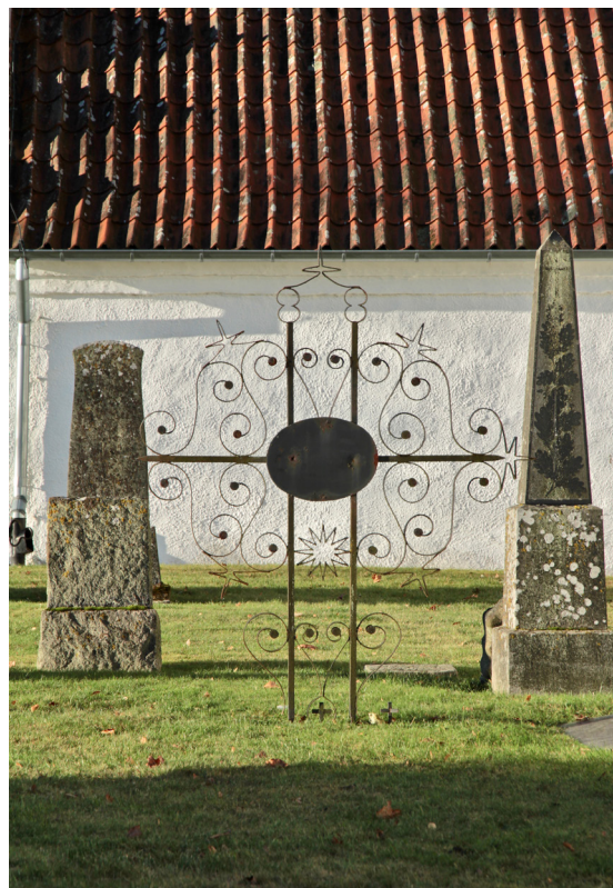
Ett av de två ovanliga järnkorsen öster om vapenhuset.

Strax nordväst om kyrkan finns en enkel byggnad av friggebodskaraktär som inrymmer toalett och redskapsbod. Byggnaden uppfördes 1964 och har fasader klädda med liggande brunmålad panel och sadeltak avtäckt med enkupigt rött tegel.