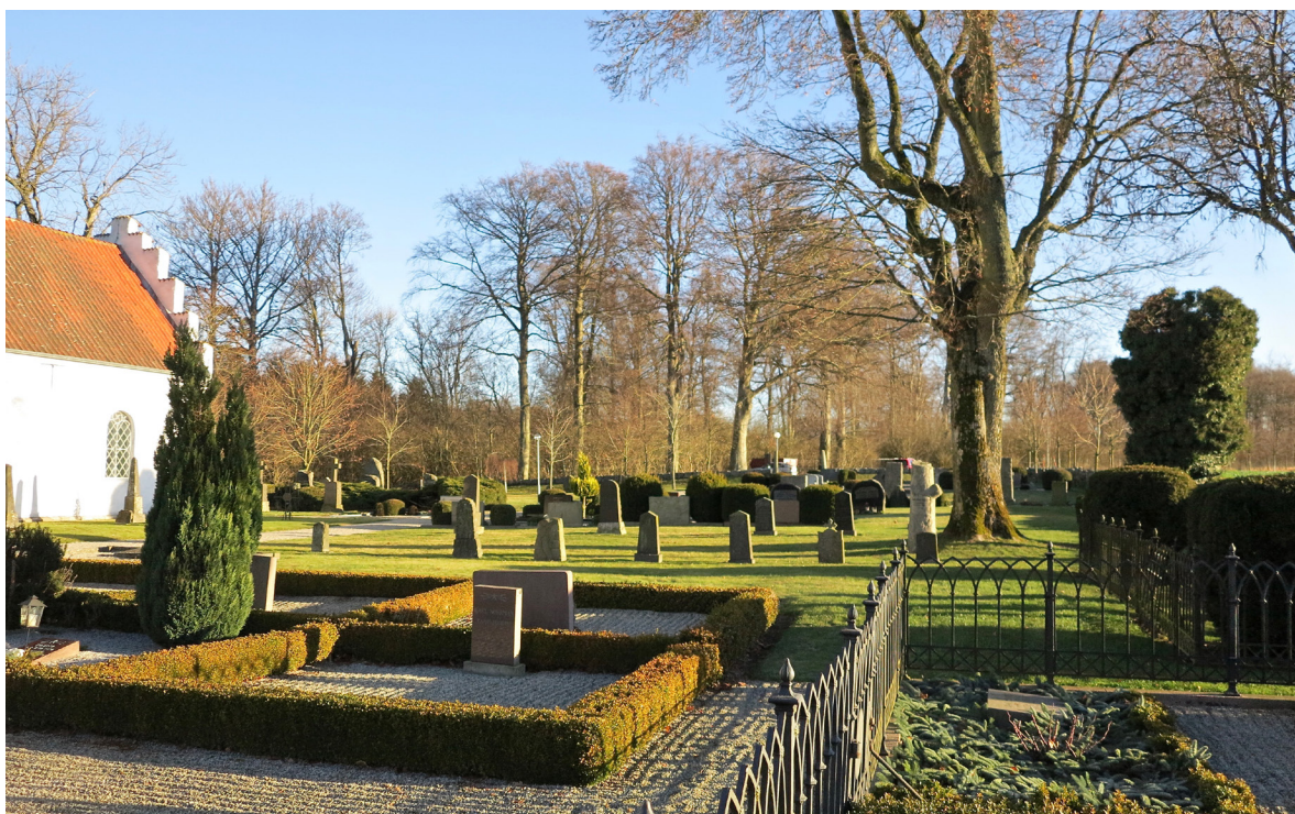
Söder om kyrkan karakteriseras kyrkogården av äldre högresta gravstenar, i vissa fall omgärdade av staket i smide.