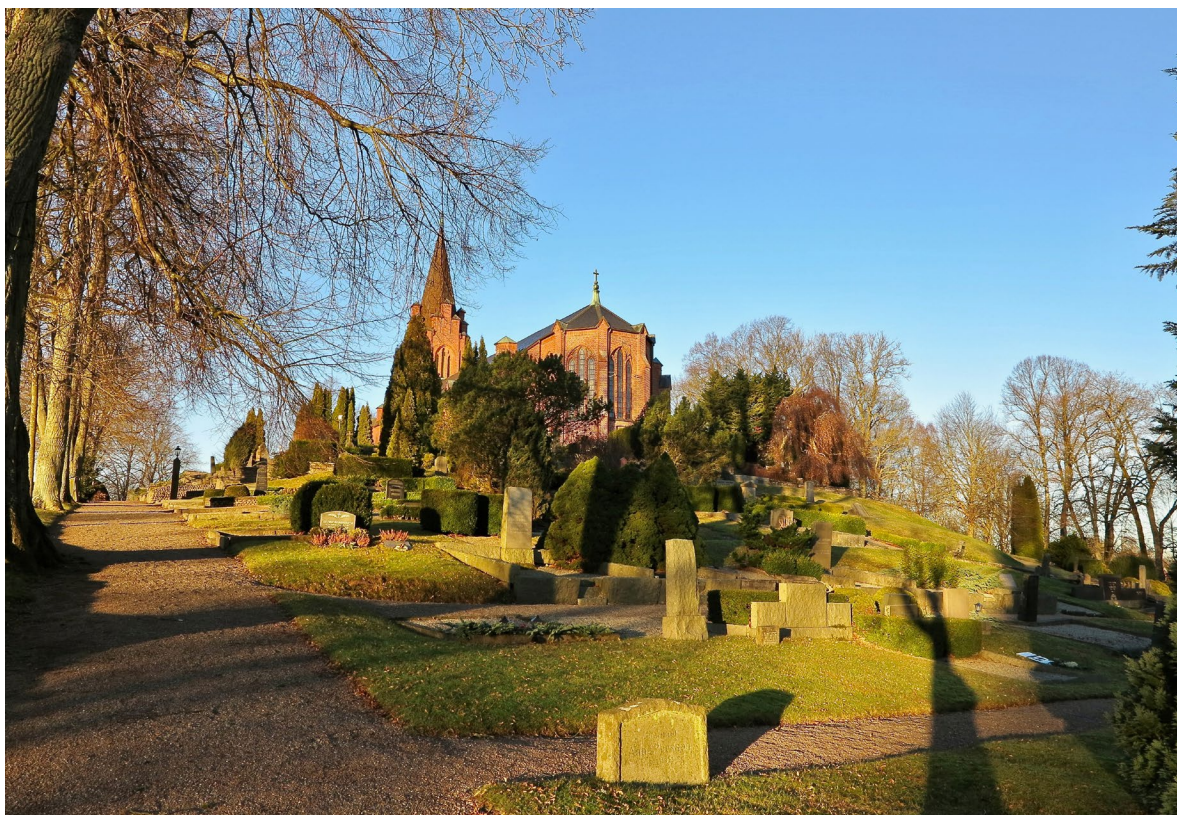
Billinge kyrkogård har en karaktäristisk 1800-talsutformning, med asymmetrisk plan anpassad efter den kuperade terrängen.

Fram till uppförandet av den nya kyrkan begränsades Billinge kyrkogård till backkrönet närmast den medeltida kyrkan. I samband med nybyggnationen utvidgades kyrkogården i alla fyra väderstreck men främst åt öster och norr. Den asymmetriska planen har drag av engelsk parkanläggning och följer den sluttande terrängen, med terrasseringsringar och slingrande gångsystem belagda med röd singel. Vegetationen är mångfaldig med höga barrträd som tujor och enar men även lägre och formklippta buskar. Lövträd förekommer dels som fritt placerade solitärer men även i mer ordnad form direkt nordväst om kyrktornet, där äldre högvuxna träd, bland annat kastanjer, inramar ett helt kvarter. Gravplatserna inramas annars i de flesta fall av lågt klippta häckar eller