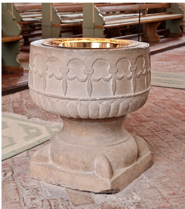
Den medeltida dopfunten utgör kyrkans äldsta inventarium.