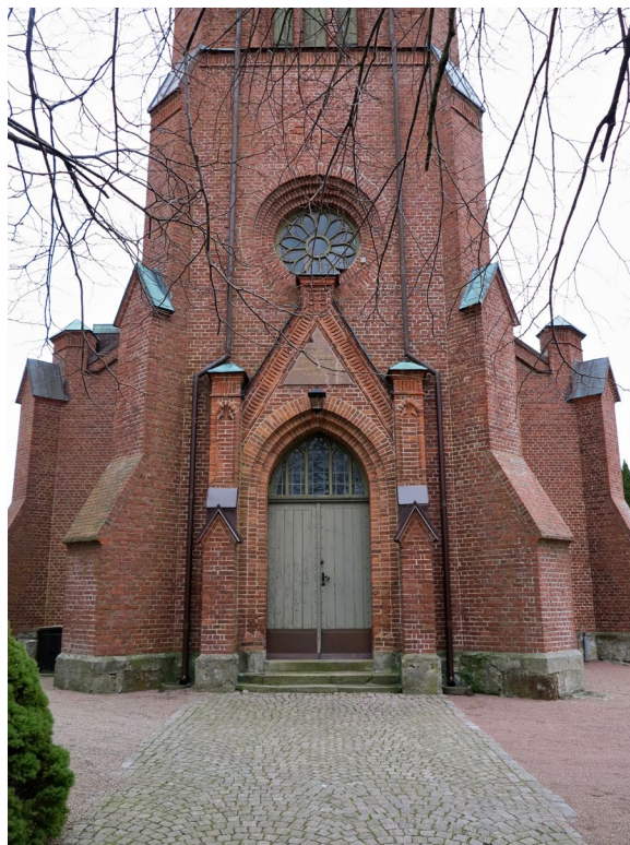
Kyrkans huvudentré i väster.

Den spetsbågiga perspektivportalen i huvudentrén i västtornet kragar in i tre språng och flankeras av strävpelare. Porten är rakslutad och har två grönmalade dörrblad med ramverk och fyllningar av stående brädor. Ovan detta sitter ett spetsbågigt överljus med träbågar och blyspröjs. Portalen kröns av ett spetsgavelparti med friser och blinderingar i formtegel. I mitten sitter en röd kalkstensplatta med inskription över kyrkans uppförande. Kyrkan har även norr- och sydportaler mitt på långhuset, med snarlik utformning men med fyra språng i perspektivportalerna och odekorerade strävpelare. Gavelfältens utsmyckning begränsar sig till ett grekiskt kors i en rund blindering.