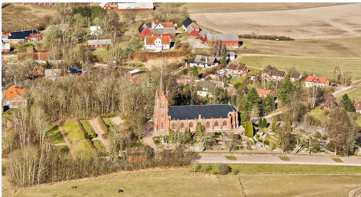
Flygbild över Billinge kyrka 2014, tagen från söder.

På 1100-talet bildade Billinge tillsammans med grannbyarna Billinge socken och lät uppföra en kyrka. Vid denna tid låg de flesta gårdarna i bygden under Lunds domkyrka. I och med reformationen (i Danmark 1536) drogs flera gårdar tillbaka från kyrkan till fördel för adeln, här familjen Thott på Eriksholm (senare Trolleholm), som på så vis stärkte sin maktposition i socknen. Vid 1800-talets skiften bestod Billinge ännu av ett 20-tal gårdar som främst var placerade utmed bygatans sträckning. Järnvägens och industrialismens intåg vid mitten av 1800-talet kom emellertid snart att påverka hela regionen genom en kraftig urbanisering. I Billinge styckades tomter av för anställda