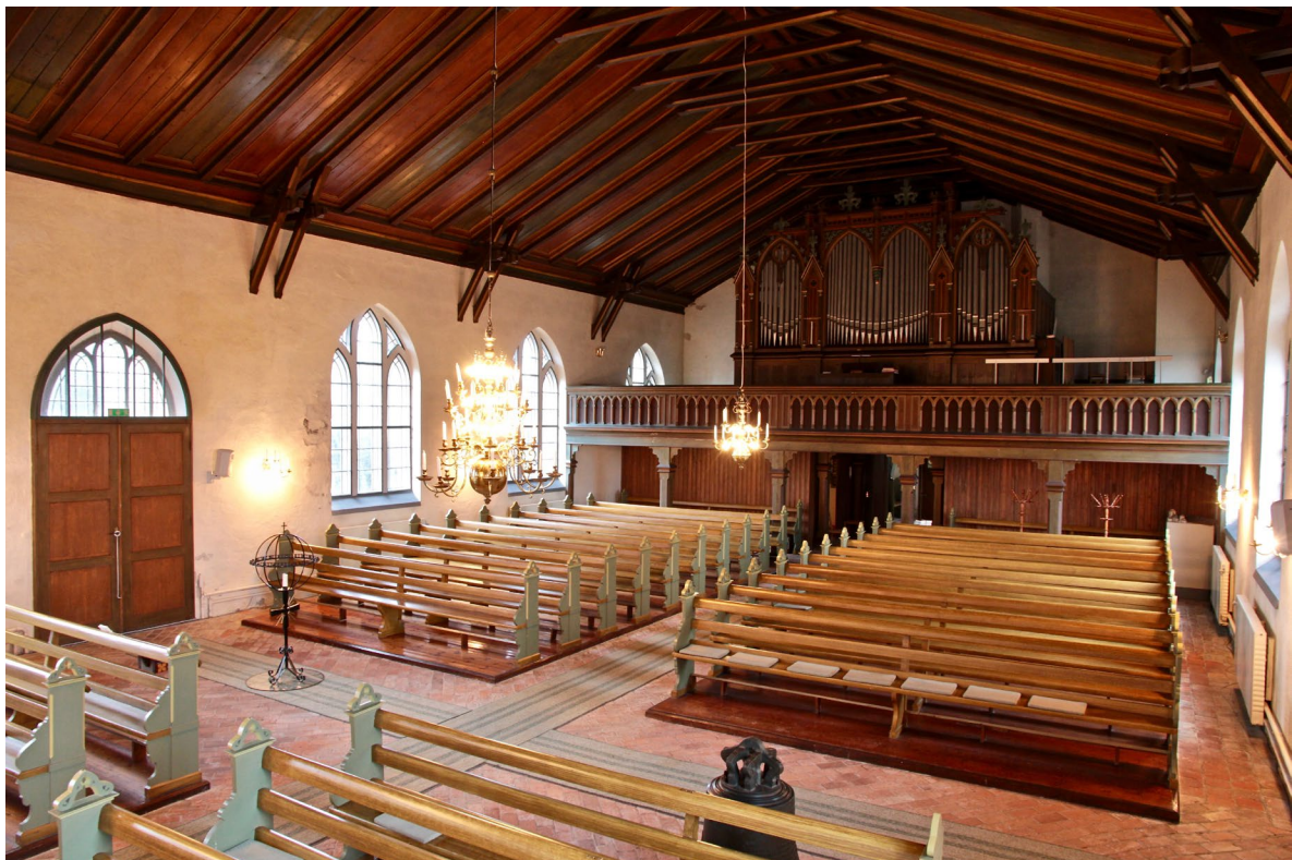
Kyrkans öppna bänkinredning och orgelfasad i nygotiskt utförande.

Den nygotiska orgelfasaden i tre sektioner med högre mittparti pryds av stiltypisk ornamentik som fyrpass, krabbor och franska liljor. Piporna är placerade i spetsbågiga öppningar med masverk som flankeras av vimperger och kröns av tureller. Orgelfasaden är laserad i bruna toner med detaljer i grönt och förgyllning.