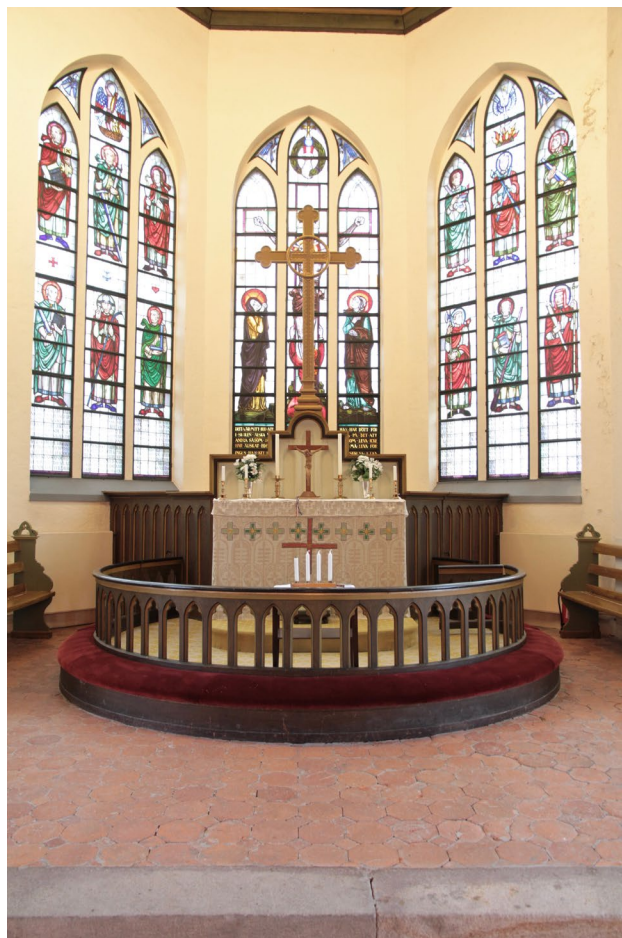
Koret med dess glasmålningar utförda 1930.

Korets östra del avgränsas av ett korskrank i trä, dekorerat med spetsbågiga blinderingar och färgsatt likt övrig fast inredning. Två dörrar på var sida om altaret leder in till utrymmet bakom altaret, som ursprungligen fungerade som sakristia men idag används för förvaring. I ett tredelat förvaringsskåp utgör mittpartiet vindfång till östportalen.