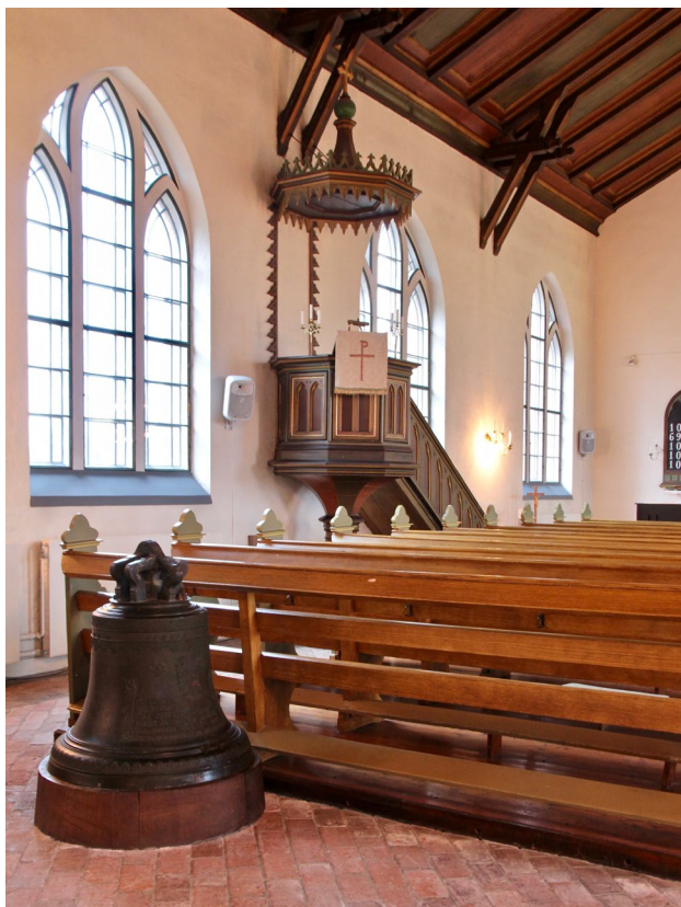
Predikstolen är placerad på norra långhusväggen. I förgrunden ses kyrkans storklocka som göts 1750.

Till funten hör ett dopfat av mässing från sent 1500-tal, vars utformning framställer Adam och Eva i Edens lustgård.