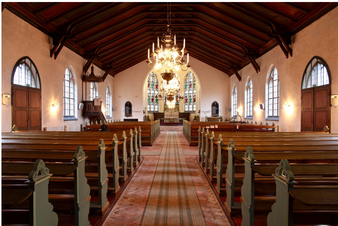
Kyrkorummet sett mot koret i öster.

I kyrkorummet når man först en farstu som tillkom 1944 genom inbyggnader av utrymmet under orgelläktaren. I norr finns sedan dess sakristian och i söder ett förrådsutrymme som också inrymmer trappan till orgelläktaren. Brädväggarna mot kyrkorummet är klädda med brunbetsad pärlspontpanel. Dörrbladen har tre fyllningar var och är brunbetsade, medan pardörren mot vapenhuset har samma utformning och färgsättning som på motsatt sida.