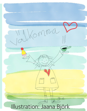
Illustration: Jaana Björk