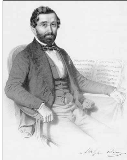
Adolphe Adam (1803–1856)

Från början blev Cantique de Noël helhjärtat accepterad av kyrkan i Frankrike och sången fann snabbt sin plats i olika katolska julgudstjänster. Men när Cappeau tog avstånd från kyrkan och deltog i den socialistiska rörelsen och när kyrkans ledare upptäckte att Adam var jude, blev sången – som snabbt hade vuxit till att vara en av de mest älskade julsångerna i Frankrike – plötsligt och enhetligt fördömd av kyrkan. Huvudansvariga för den franska katolska kyrkan vid den tiden dömde Cantique de Noël som olämplig för kyrkans gudstjänster på grund av dess brist på