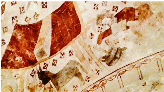
Väggmålning i Skivarps kyrka

Om hans far, eller rättare sagt styvfar, Josef vet vi inte mycket, annat än att han var snickare och avlägsen släkting till Maria. Hur han var som person är svårt att veta, men det finns antydningar lite här och där. Han verkar varit omsorgsfull och snäll, vilket märks i det att han ville skilja sig från Maria i tysthet (Matt 1:19) istället för att skämma ut henne och göra en stor affär av hennes utomäktenskapliga graviditet. När han sedan istället stannade vid Marias sida verkar han ha uppfostrat Jesus som sin. I Skivarps kyrka finns en fantastisk väggmålning som visar hur Josef lagar gröt eller välling till den nyförlösta Maria. Vilken fantastisk man och pappa!