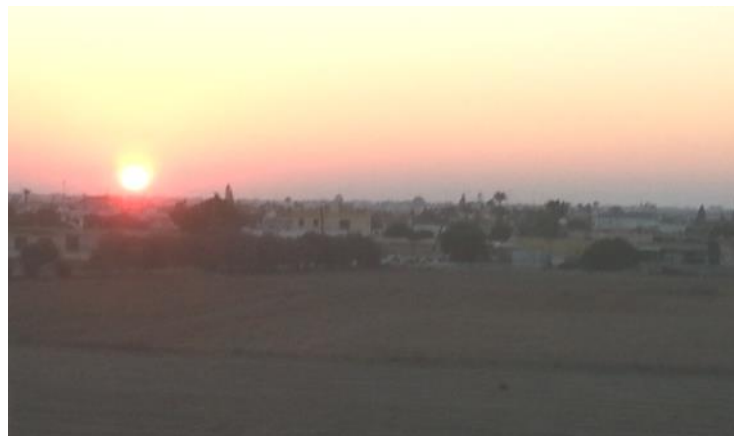
Utsikt fra leiligheten

Jeg bodde då i Ayia Napa, og ble kjent med mange hyggelige nordmenn og svensker. Gjennom kirken og utenom kirken, og de har jeg fortsatt kontakt med per idag. Da jeg fikk skikkelig diagnose på Famagusta General Hospital, sa legen der at jeg måtte flytte til et varmere land, dette for å ha en bedre livskvalitet. Jeg flyttet ut av Norge 2016, og jeg kjøpte min leilighet med vakker utsikt og mye sol. Det var grunnen til at valget falt på Sotira. Også at der var svømmebasseng, så jeg kunne trene hver dag om sommeren. At veien er kort til Ayia Napa har også betydning for meg. Utfordringen var å ta bilen for å kjøre på venstre siden, men utrolig nok, så har det gått veldig bra. Jeg tok 5 timer med kjoerelærer, og da sa hun: Kjør alene, dette klarer du! Oj, tenkte jeg, og tok bilen og kjørte både her og der, på ukjemte stier og mange fine landsbyer ble oppdaget. Det gjelder bare å tenke motsatt av det du gjør i Norge når du kjører.