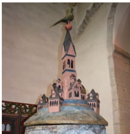
Dopfontens ståtliga trälock från 1200-talet.