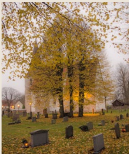
Allhelgona i Väinge kyrka.