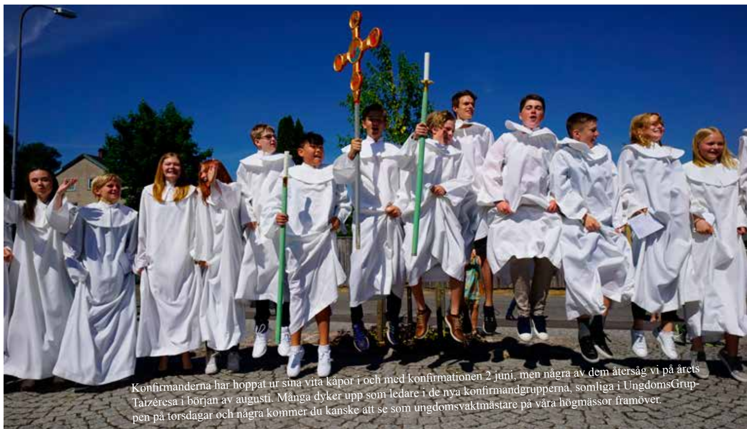
Konfirmanderna har hoppat ur sina vita kåpor i och med konfirmationen 2 juni, men några av dem återsåg vi på årets Taizéresa i början av augusti. Många dyker upp som ledare i de nya konfirmandgrupperna, somliga i UngdomsGruppen på torsdagar och några kommer du kanske att se som ungdomsvaktmästare på våra högmässor framöver.

ulrica.karborn@svenskakyrkan.se. Ange verksamhet, barnets namn, personnummer, ev. allergier, telefonnummer samt mailadress till vårdnadshavare. Alla grupper utom Öppna förskolan och Söndagsskolan har uppehåll under skollovets v. 44. Ulrica Karborn, 0738-520464. Barnpedagog Stensjökyrkan/Fågelbergskyrkan