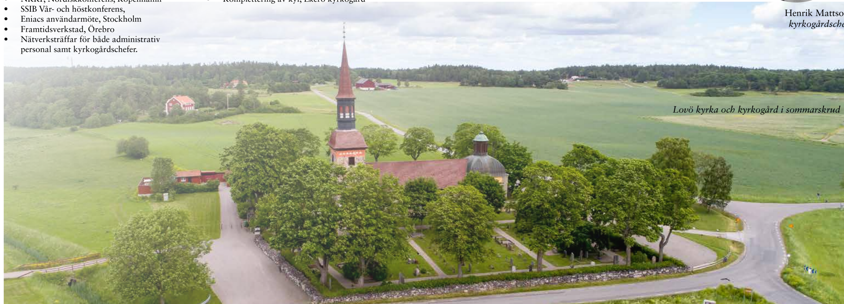
Lovö kyrka och kyrkogård i sommarskrud