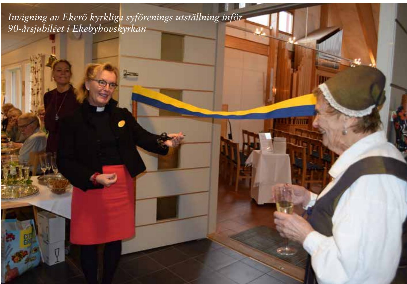
Inviqning av Ekerö kyrkliga syföreningens utställning inför 90-årsjubiléet i Ekebyhovskyrkan