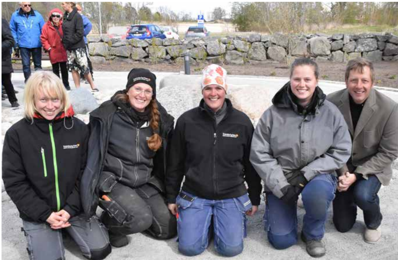
Invigning Munsö askgravlund 9 maj