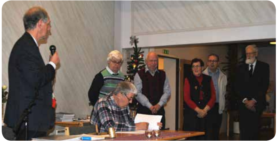
Tidigare kyrkofullmäktigeledamöter avtackades.