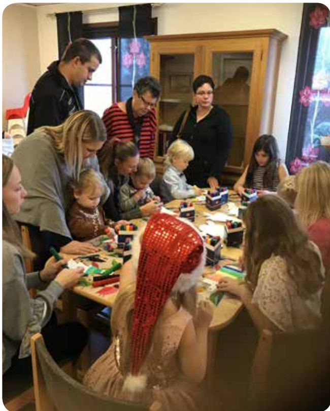
Familjedag med gudstjänst och olika aktiviteter i församlingshemmet i Bromölla.