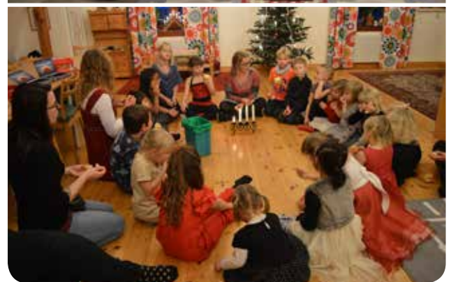
Avslutning i Näsum med gudstjänst i kyrkan och aktiviteter i församlingshemmet.