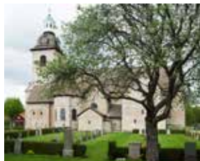
Vreta klostrets kyrka

ansvariga, gudstjänsttekniker (utför de traditionella kyrkvaktmästarsysslorna), körsångare, kyrkvårdar och söndagskolledare. Ambitionen är att hitta fler sätt för fler personer att hjälpa till i gudstjänsten. Dock får det inte vara så att människor ska känna sig tvungna att "göra något". Gudstjänsten måste få vara en plats där vi får vila och hämta kraft, inte en börda som tynger och kräver.