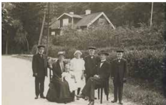
■ Familjefoto vid Södertäljevägen med Klockargården i bakgrunden.