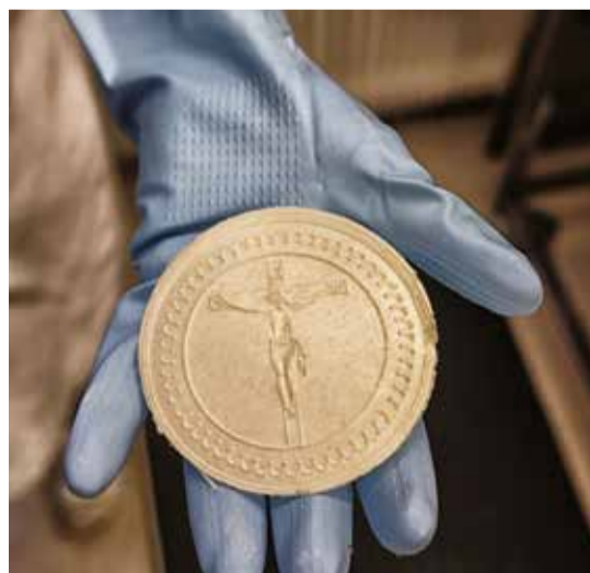
■ På Ersta bageri bakas oblater som delas ut vid nattvarden i samband med mässan.

– Efter konfirmationen fick vi välja vad vi vill fortsätta med här på Ersta. Som volontär får vi välja