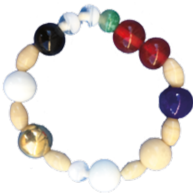
■ Frälsarkransen är ett modernt kristet radband med pärlor av olika betydelser.