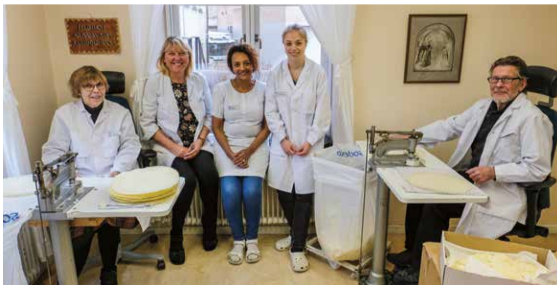
■ Ersta oblatbageri är en mötesplats för både volontärer, anställda och pensionerade diakonissor.

Hon ställer sina gräddade oblater i ångsskåpet så att de får rätt fuktighet och blir lättare att stansa ut.