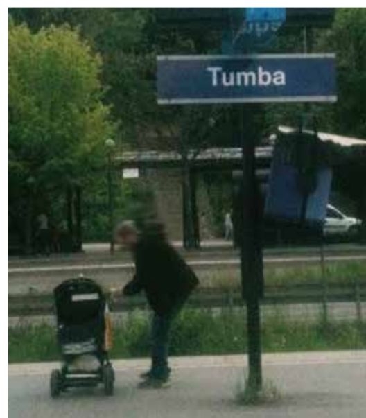
Andakt på väg är en kort andakt skapad för dig som är på väg någonstans.

Nu finns 52 filmer, inspelade i våra kyrkor. Alla filmer är på svenska och har svensk textning.