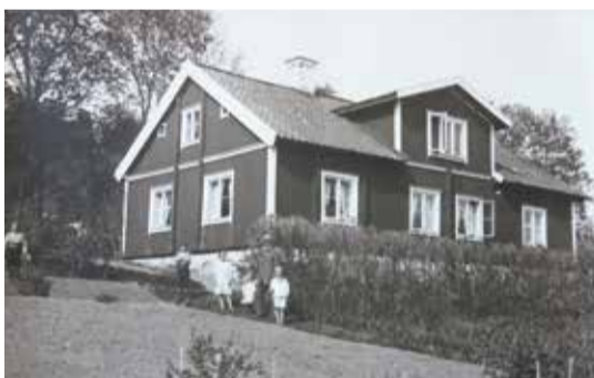
■ Aina är både född och uppvuxen i Klockargården, som ligger strax intill Botkyrka kyrka. På bilden är Aina

»Då var det världens fest! Botkyrka kyrka fylld med tända ljus och folk kom åkande till kyrkan med slädar.«