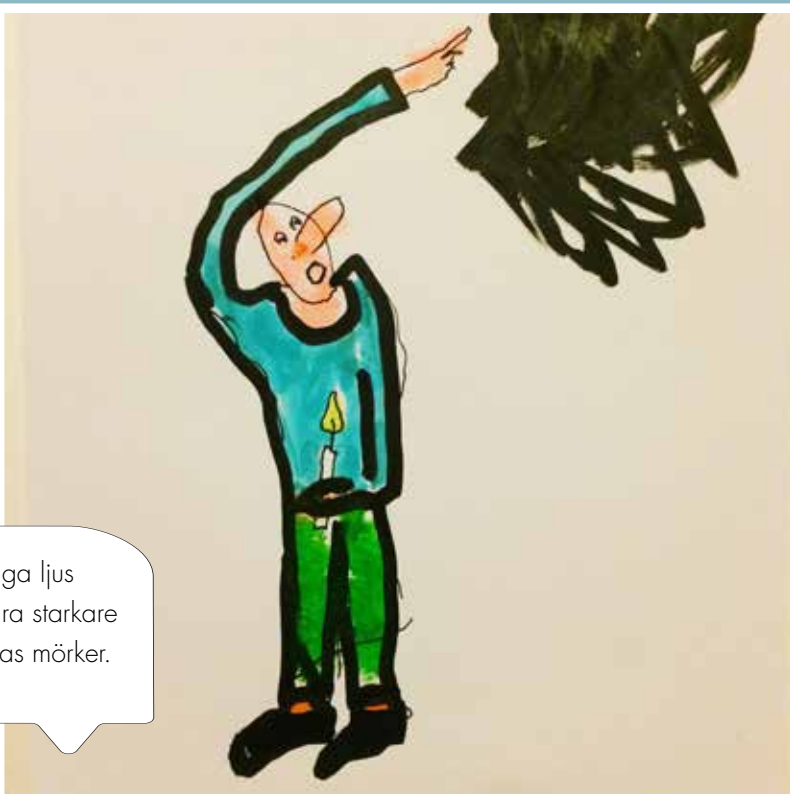
Följ Dagdroppar på instagram eller bloggen http://universitetskyrkan.karlstad.blogspot.se om du vill se fler

Vårt bräckliga ljus visar sig vara starkare än makternas mörker.