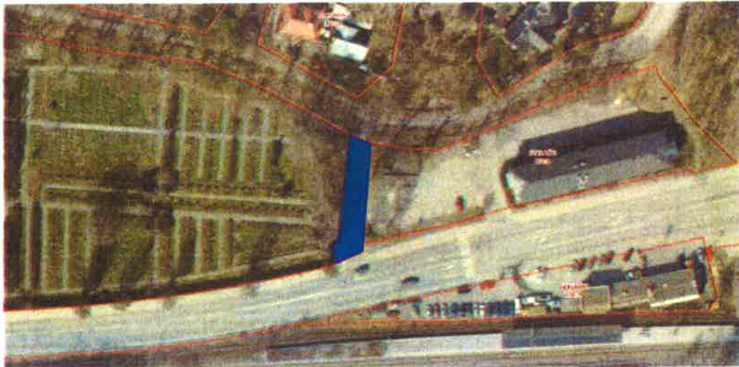
Servitutsområdet markerat i blå färg

Vid nyttjande av servitutet får in- och utfart till begravningsplatsen genom muren inte hindras. Mer mark får inte tas i anspråk än att det finns plats kvar till tre (3) parkeringsplatser varav en (1) handikappanpassade för kyrkans nyttjande. Kommunen ombesörjer att dessa tre platser iordningsställs senast i samband med att den allmänna platsen byggs ut.