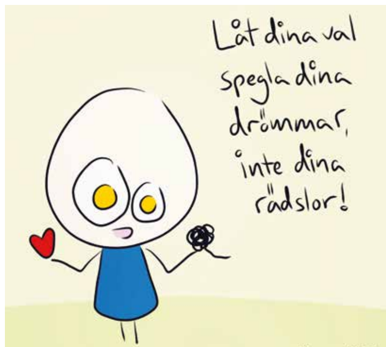
ILLUSTRATION: ROYNE MERCURIO