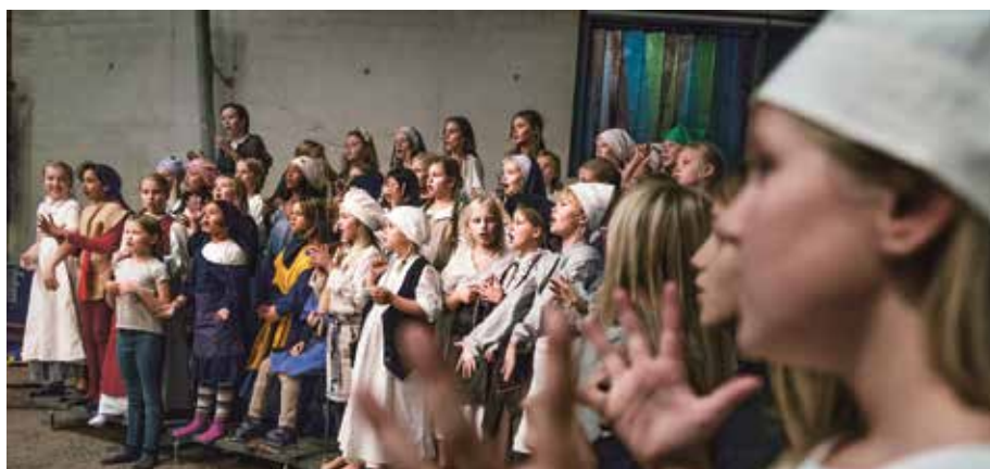
Luthers ungar framförd i Turebergskyrkan