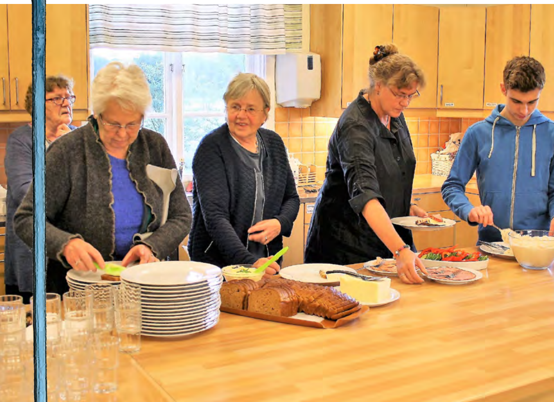
Lutherkväll med god mat i Skatelövs församlingshem

Församlingsblad för Skatelöv och Västra Torsås • Hösten 2017