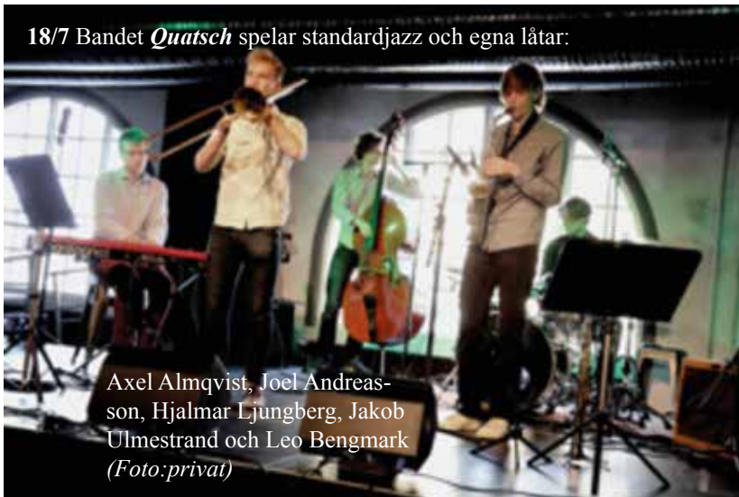
18/7 Bandet Quatsch spelar standardjazz och egna låtar: