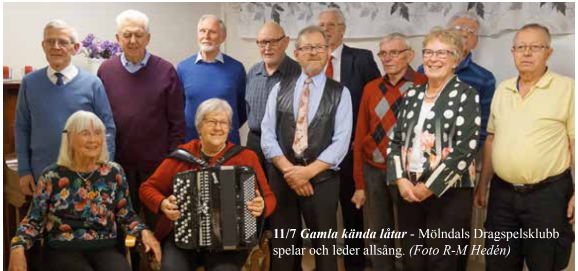
11/7 Gamla kända låtar - Mölndals Dragspelsklubb spelar och leder allsång.