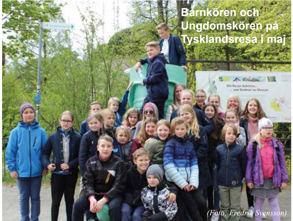
Barnkören och Ungdomskören på Tysklandsresa i maj

Stensjöns Kyrkokör (vuxna) Onsdagar kl.19.00-21.15. Start 23 aug.